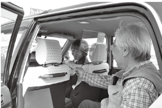
▲タクシー券を使って割り引きを受けられます