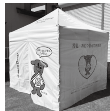
▲おむつ替え用のベッドと椅子を設置してください。

市内で開催されるイベントなどに乳幼児の授乳やおむつ交換を行うためのスペースとして、「移動式赤ちゃん休憩室」を貸し出しています。