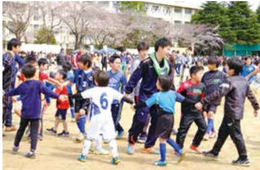
サッカー部の体験教室では、シュート練習などを行いました

主催の勝田台あそび隊実行委員会を中心に、八千代高校や近隣の小・中学校、子ども会など地域で活動する団体が、一同に集まって開催されている勝田台桜まつり。15回目を迎え、たくさんの人から親しまれる地元の一大イベントとして定着しました。