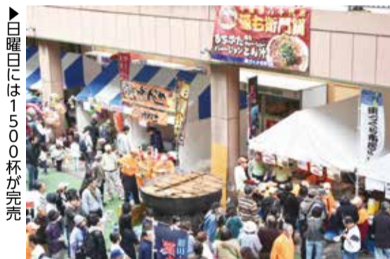
▶日曜日には1500杯が完売

4月8日・9日に開催された源右衛門祭。1724年(享保9年)に、初めて新川の治水に取り組んだ人物とされる染谷源右衛門と、開削にかかわった人たちの恩を、感謝するお祭りです。