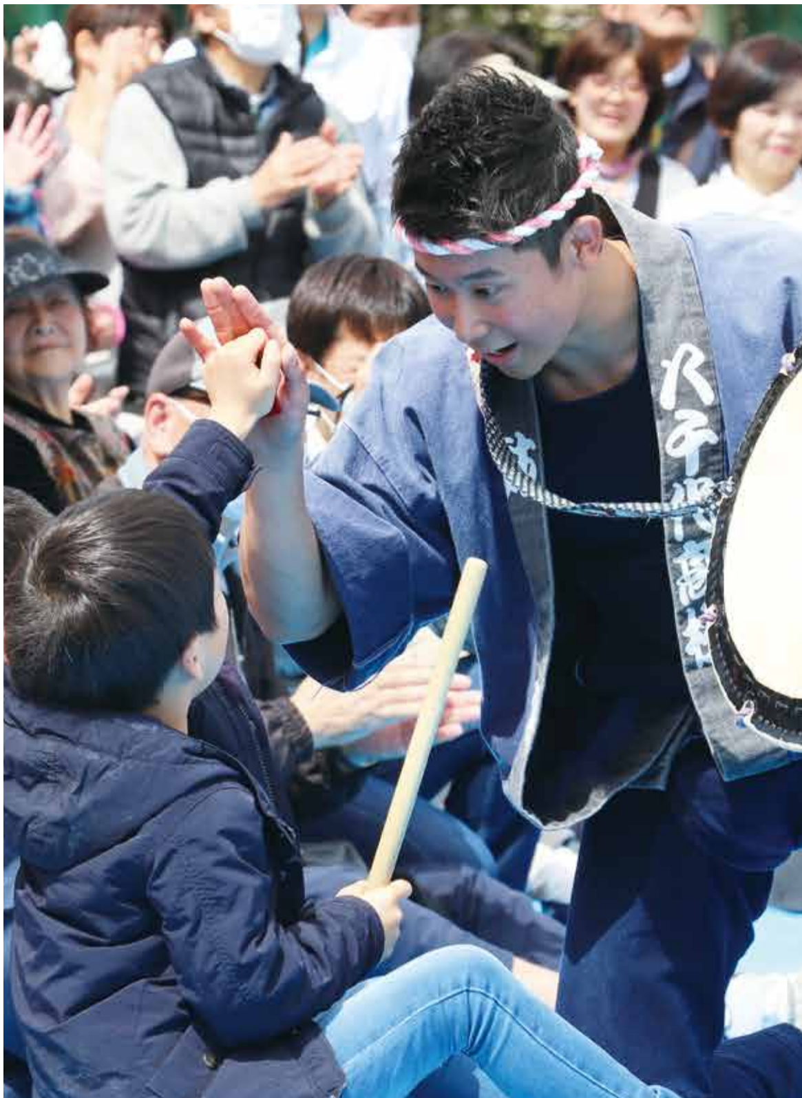
▲鼓組のお兄さんとハイタッチ。この出会いが和太鼓に興味を持つきっかけになるのかも(勝田台桜まつりで)

鼓組は県内公立高校で唯一、和太鼓を中心に行う八千代高校の部活動です。昨年の関東地区和太鼓選手権では金賞に輝き、数多くの実績を残しています。日本屈指の「成田太鼓祭」でも演奏し、つつじ祭りなど市内のイベントでも活躍しています。演奏はプレゼンツの気持ちで、練習も含め演奏会の企画・運営を部員自ら実践。多くの人に和太鼓に触れてほしいとの想いから、5月には体験会を企画しています。日本の伝統文化でもある和太鼓と真剣に向き合う生徒たちの想いが、たくさんの人から親しまれ、子どもたちの憧れとなり、次の世代へと受け継がれていきます。