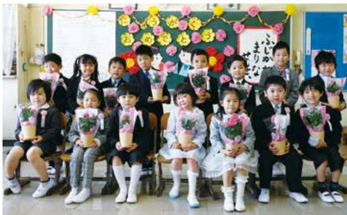
▲米本小学校15人のピカピカの新入生

4月9日、新入生たちはドキドキの入学式を終えて教室へ向かいます。自分の名前が書かれた椅子に嬉しそうに座りました。教室の前には、この日のために用意されたミニバラの苗が。きれいに咲いたミニバラを、