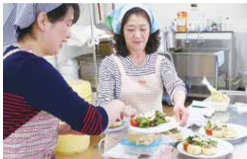
▲生地は冷蔵庫で3日保存できます

農業交流センターで、4月10日に開催されたおうちパン講座。スマイルデイズ八千代村