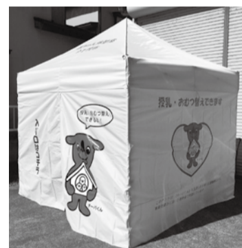
▲おむつ替え用のベッドと椅子を設置

市内で開催されるイベントなどに乳幼児の授乳やおむつ交換を行うためのスペースとして、「移動式赤ちゃん休憩室」を貸し出しています。