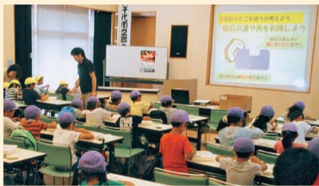
八千代のことをみんなが学びます

市内の歴史や伝統行事など、希望するテーマに沿って学びます。土器や石器に触れたり、勾玉を作ったりする体験講座もあります。