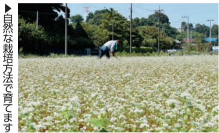
▲自然な栽培方法で育てます

やちよ農業交流センター近くの畑で、かわいらしい白い花が咲きそろいました。4月に種をまき、6月下旬に収穫をする夏そばの花です。通常、そばは花をつけてからひと月ほどの黒く実が熟した時期に収穫しますが、梅雨の時期に収穫する夏そばは、雨や台風で被害が出ないように、まだ実が青みが残るうちに収穫するため、秋そばに比べると新鮮でさわやかな風味になります。この畑では、化学肥料を使わず、ライ麦を肥料として使い、土壌にも環境にもやさしい自然の味を育てています。このそばが市内の直売所に並ぶ8月にまた新しい種をまき、秋空の下でも白い花を楽しむことができます。