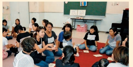
保護者同士で子育ての悩みを解消しましょう

子育てのフリートークや絵本「ザガズー」の読み聞かせを通じて、頑張りすぎない育児ができるように楽しいひとときを過ごします。