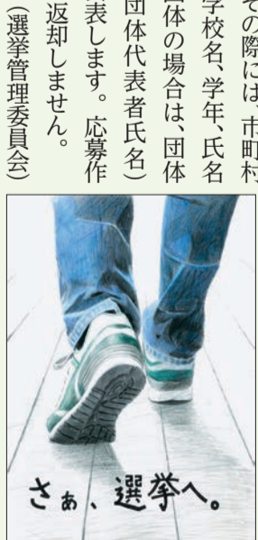
▲昨年、国の高校生の部で会長賞を受賞したポスター

■応募方法 ポスターは作品裏の右下に、標語は作品表の左に学校名、学年、氏名(フリガナ)を記入し、動画は、必要事項を記入した応募用紙(HPに掲載)を添えて、9月7日(金)までに〒276-1850 1市選挙管理委員会へ郵送または持参。入賞作品の著作権は主催者に属し、作品は啓発活動などに使用します。その際には、市町村名、学校名、学年、氏名(団体の場合は、団体名・団体代表者氏名)を公表します。応募作品は返却しません。