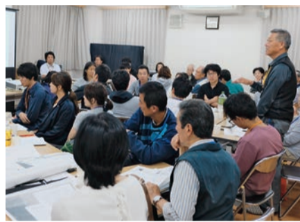
▲八千代台東のまちづくりは、住民が率先して取り組んできた歴史があります

平成26年度末に学校としての役割を終えた旧八千代台東第二小学校。この跡地活用について考えるワークショップが6月16日に八千代台東町会館で行われ、28人が参加しました。今回は、これまでの経緯や、活用の条件などを共有し、3グループに分かれて、意見を出し合いました。今後は、具体的な跡地活用、運営や維持管理の方法について話し合いを重ねていきます。