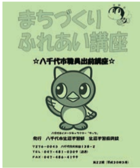
講座を探してみませんか

内容は、身近な生活に関するものから専門的なものまでさまざまです。市内在住か在勤・在学のおおむね10人以上の団体・グループが利用できます。詳しくは、市役所案内、支所、公民館などで配布している「まちづくりふれあい講座」のパンフレットや市ホームページからダウンロードしてご覧ください。登録講座一覧表にないものでも、特別講座として開催できることがありますので気軽に相談してください。