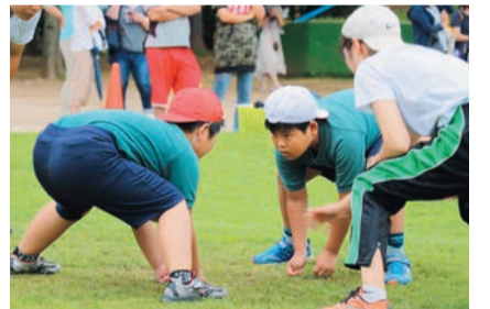
▲合図直前。水を打ったように静まります

6月28日、勝田台小学校ですもう大会が行われました。小運動会として40年以上続いている勝田台小の伝統行事。全クラス総当たりの学級対抗戦で、みんなが主役となり、たくさんの保護者や観覧者が応援に来ました。芝生に描かれた土俵で、この日のために体育はもちろん、朝や昼休みにも練習を重ねてきた子どもたちが気迫あふれる真剣勝負を繰り広げました。取組が始まるとともに周囲からは熱い声援が。決着がつくたびにクラス全員で一喜一憂していました。転んでも、泣いても、くじけずにまた次の試合に取り組みます。来年も、汗と涙がしみこんだこのグラウンドで、たくましくなった姿が見られることでしょう。