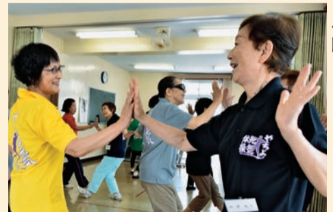
やちよ元気体操でロコモを予防しよう