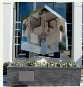
▲平和祈念碑に献花します

▼日時 8月6日(月)午前8時 ▼場所 市民会館大ホール前ホワイエ (総合企画課)