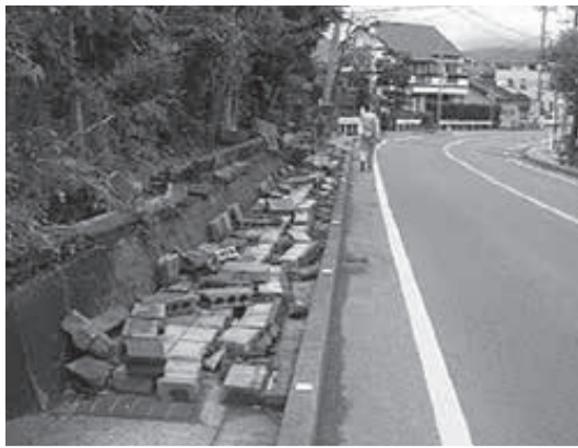
歩道には倒壊したブロック塀が

危険なブロック塀は、建築基準法施行令の基準に適合した安全なものに直すか、フェンスや生け垣などにつくり変えましょう。生け垣の設置