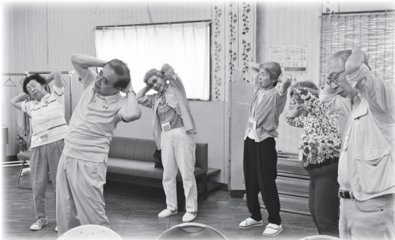
教養を深め、仲間をつくり、時事問題、社会福祉、文化などについて学びます。一般教養コース、健康福祉コースの2種類があります。就業年限は1年（4月～翌年3月）です。詳しくは長寿支援課へ。

地域の高齢者が気軽に参加でき、地域の人と交流ができる通いの場です。現在、市内に28団体あります。週1回2時間程度、簡単な運動や脳トレなどを中心に、介護予防に役立つ活動をしています。お茶菓子などの実費がかかります。詳しくは長寿支援課へ。