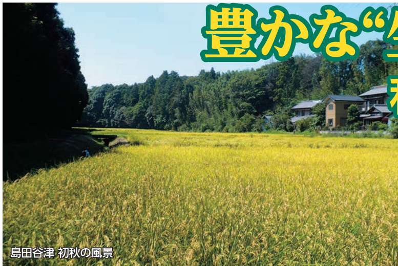
島田谷津 初秋の風景