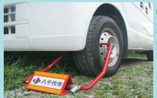
▲自動車差し押さえは、タイヤロックをします

督促後も納付がない場合に、こうした処分を受けることになります。納めるのが難しい場合は放っておかず、できるだけ早く相談し、きちんと納めてください。