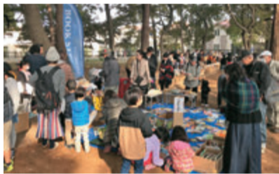
▲古本3冊で1冊と交換できました

八千代台西市民の森で、11月18日にやちにしピクニックが行われました。地域の活性化やものづくりをする人と、住民をつながたいという思いから、「BOOK STREET 秋の本祭り」と「やちにしまるシェ」を初めて合同で企画。森の小道には3,000冊もの本がずらり。おしゃれな手作り雑貨のお店などが並び、ジャズの演奏などのパフォーマンスも。約3,000人が訪れ、静かな森が活気にあふれました。