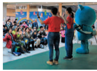
▲一緒にダンスを楽しみました

11月4日、フルルガーデン八千代で開催されたやちよ市民活動フェスティバル。15回目を迎え25団体が参加しました。環境や福祉など幅広い活動をパネルで展示し、ステージでは子どもたちがダンスの披露も。活動に関連するクイズに答えながら各団体を回るスタンプラリーも行われました。訪れた人からは「いろいろな活動をしている団体のことを知ることができて良かったです」との声が。交流を通じて、市民活動の輪を広げることができました。