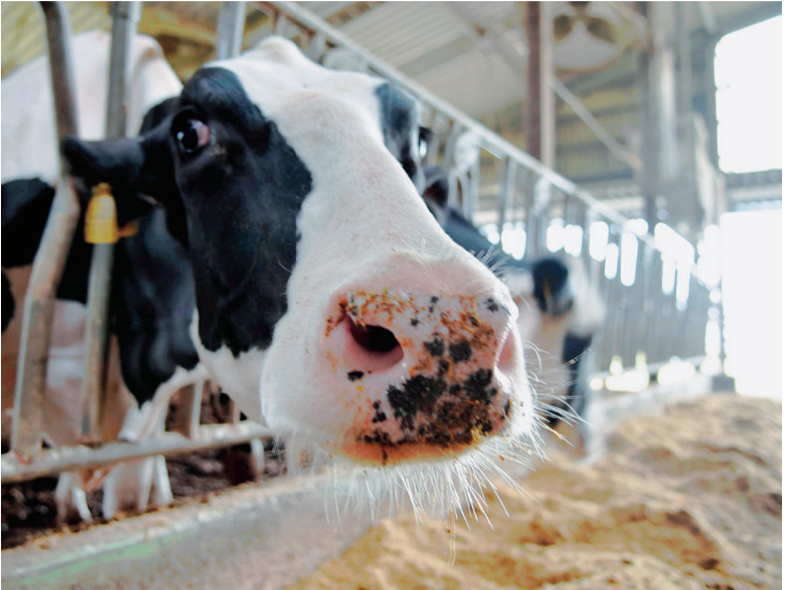
▲吉橋の高秀牧場のハイエクセルクイーンハマー。10月の県乳牛共進会で農林水産大臣賞を受賞し、11月の関東共進会は見事準名譽賞を受賞

千葉県は、日本の酪農発祥の地です。現在の南房総市で、江戸時代に八代將軍徳川吉宗が白牛を輸入し、乳製品を作ったことが始まりです。