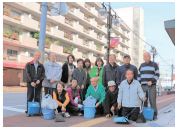
◀毎回15人程度が参加の月1回のごみ拾い

それから始めたのが月1回の清掃。以前は歩道にある花壇へびんや缶などが多く捨てられていましたが、地道な活動で次第に量が減りました。毎月発行している自治会だよりでは、ごみの分別や出し方を紹介。日常の生活でできる、マイバックの利用や運動の時にはペットボトルに水道水を入れて持参することなども勧めて