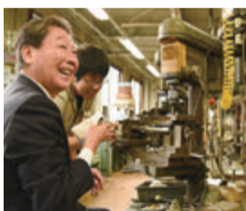
▲フルーツの製作を体験