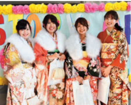
振り袖など華やかな衣装に身を包み同級生との再会を楽しみました

市民会館で1月13日に行われた成人式。今年は1,376人の新成人が出席しました。プロジェクトメンバーによる記念行事では、中学校時代の先生からのビデオレターが流れ会場は笑顔に。3年後の自分への手紙や後輩へコメントを送るコーナーも用意しました。「OB・OGなどたくさんの人の協力で実現できました」と新成人でもある同メンバーのみなさん。感謝の気持ちを忘れずに、晴れ舞台を楽しみました。