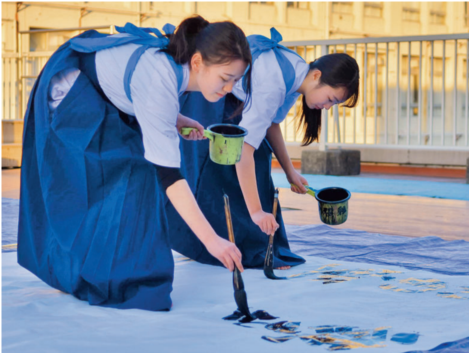
▲一辺が6m以上の大きな作品を作ることも。書道も軽快なリズムが大事。音楽に合わせたパフォーマンスで見る人を驚かせます

文字の意味や形、墨の濃淡やにじみなどで思いや感情を表現する、日本の伝統美の一つである書道。しかし「書き初め」という言葉を懐かしく感じてしまうほど、今では生活の中で筆を使って文字を書く機会が少なくなっています。 八千代東高校の書道部は、3年前から校外での書道パフォーマンスに取り組んでいます。落ち着いたイメージの書道を観る人も楽しめるように話し合いを重ね、会場と一体になって一つの作品を創り上げる場所に難しさと魅力があります。 作品は個人の技術よりも、掛け声や手拍子で息を合わせることが大切。大きな筆が紙の上を滑り出すと、清々しい墨の香りが凜とした空気を生み出します。