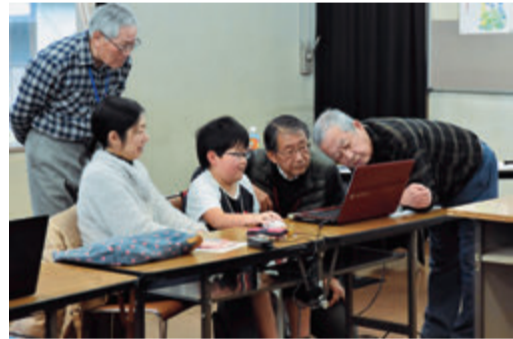
▲シルバー人材センターの講師がわかりやすく指導

勝田台公民館とシルバー人材センターの共催で行われたパソコン教室に、親子5組が参加しました。初日はキャラクターに指示を与えて動かす基本的なプログラミングを学習。2日目は、魚や動物を画面上で動き回らせるなど、それぞれが宿題で作ってきた自信作をみんなに披露しました。思い通りに動かせたときの達成感が醍醐味のプログラミング。インターネットを使うときの注意点も親子で学びました。