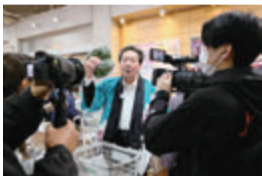
▲市内産の野菜を購入

J:COMチャンネル(11ch)で、3月31日(日)まで毎日放送中。時間は、月曜・火曜日午前10時30分、水曜日午後6時30分、木曜日午前9時、金曜日午後9時30分、土曜日午前8時30分、日曜日午後7時、ほか。▲市内産の野菜を購入