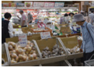
▲にぎわう直売所の様子

パネリストやシンポジウム参加者との交流会。▶日時 3月10日(日) 午後4時30分から ▶場所 市役所地下食堂 ▶参加費 1,000円