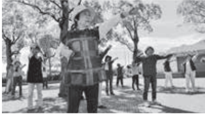
▲毎月2回開催しています

▶日時 3月15日(金)・22日(金)午前9時～9時30分(小雨中止) ▶場所 総合運動公園噴水広場(市民体育館隣) ▶持ち物 飲み物