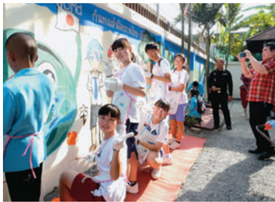
▲心を込めて訪問の思い出をつくりました

バンコク都はアジア圏では比較的近く、親日的で日本の皇室との結びつきが強いことなどから派遣先として選ばれました。人口や面積などの規模は大きく違いますが、心のつながりが強い絆になって、これまでの交流を支えています。