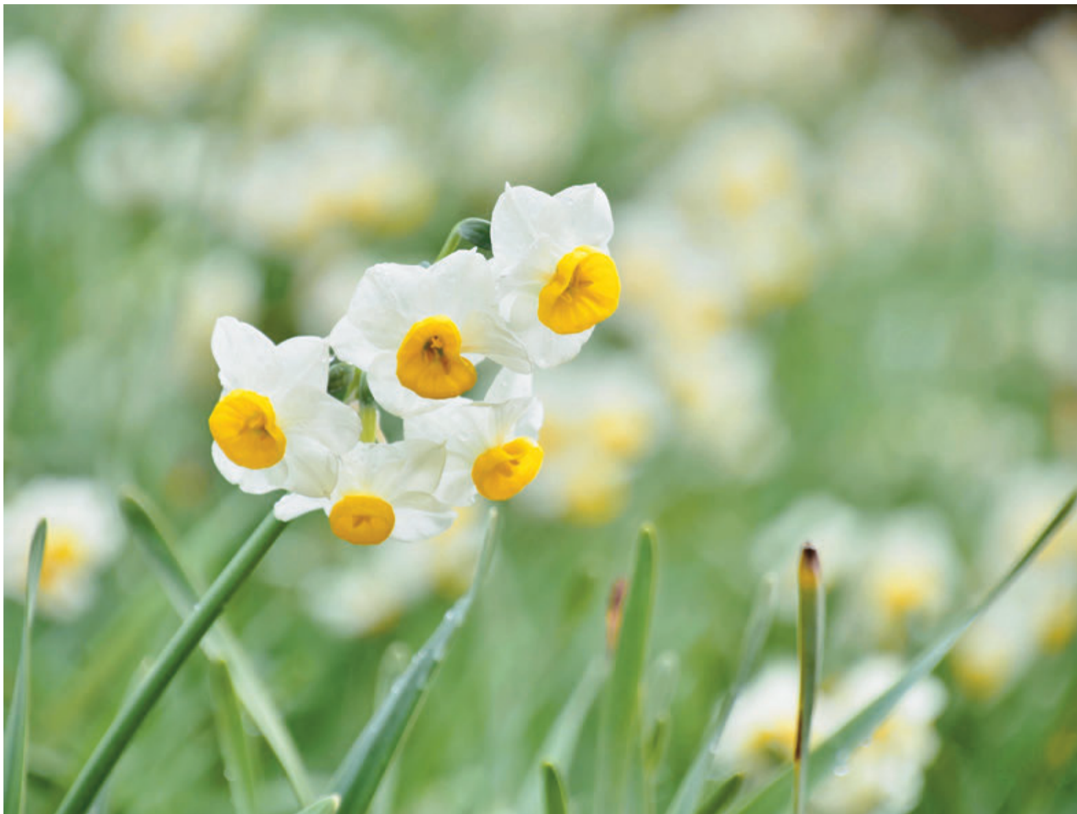
▲3月30日から4月7日の午前10時～午後3時30分、萱田地区公園でスイセンの観賞会を開催。写真はニホンズイセン、2月7日撮影

冬の寒さの中で花を咲かせ、春の訪れをいち早く知らせるスイセン。約7万5,000株が植えられた萱田地区公園では、ニホンズイセンからバトンタッチして、これからの3月下旬からは大輪の花をつけるラッパスイセンが楽しめます。これらの球根は、市民ボランティアのグリーンサポーターの協力で植えられました。美しい花は見るだけでも癒されますが、自分の手で育ててみると感動もひとしお。手をかけた分、ちゃんと応えてくれるので「きれいだね」と言われると、まるでわが子をほめられたような気分になるとか。けなげに咲く花は、私たちに心豊かな毎日と、育むことの喜びをそっと教えてくれます。