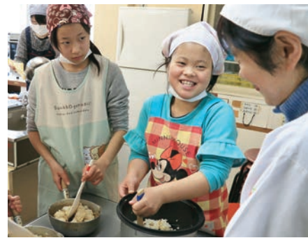
▲醤油で煮た小さい鶏肉をごはんに混ぜます

2月23日に大和田公民館で開催された親子料理教室で、八千代に伝わる懐かしい味「高津のとり飯」や「ばらっぱまんじゅう」を作りました。とり飯は、味付けは醤油、混ぜるのは鶏肉だけ。まんじゅうは、あんこをまんじゅうの皮で包み、座布団のように「ばらっぱ（サルトリイバラ）」の葉を下に敷きます。ほかにも、薄力粉と砂糖、醤油などで、メリケン粉焼きも作りました。参加