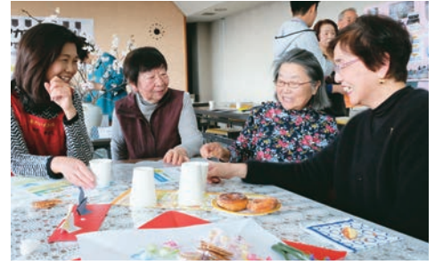
▲カフェで新しい出会いが生まれました

「こんなことをやってみたい」「誰かの力になりたい」など、市民活動団体などが集まって交流できるカフェが2月23日、福祉センターで開催されました。ボランティアカフェは、市民や団体が新たな仲間づくりや情報交換、互いに活動するきっかけづくりを目的に初めて開催。市民活動サポートセンター11団体とボランティアセンター10団体のほか、多くの市民などが参加しました。会場では、来場者への活動紹介や実演のほか、団体の会員同士で交流し、活動へのメンバーの勧誘なども行われました。いろいろなボランティアに参加してみたい。さまざまな活動している団体と出会えてよかったなどの意見がありました。