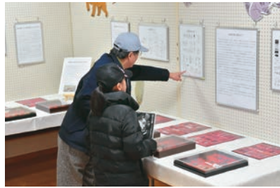
▲縄文土器や墨書土器も展示されました

2月23日・24日、緑が丘公民館で石器の展示会が行われました。約3万8,000年前に大陸から日本へと渡ってきた人たちが残したもので、萱田遺跡群から発掘されました。一部を研磨し木を伐採するおのの刃として使ったり、形を台形に整えて槍先などに使ったりしていたと考えられています。住んでいる地域の環境に合わせて巧みな生活様式を生み出し、その中で作られた石器には知恵と工夫が詰まっています。訪れた人も何か想像するように興味深く見ていました。展示会は4月6日(土)・7日(日)午前9時30分からオーエンス八千代市民ギャラリーでも開催します。