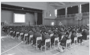
▲高校生が被害者になることも

ネット社会やカード社会と呼ばれるほど、幅広い年代が利用するインターネットやクレジットカード。悪質商法などのトラブルに巻き込まれる事件が後を絶ちません。消費生活センターでは、こうした問題の解決方法を学んでもらうため、消費生活相談員による消費者教室を行っています。2月には、高校生世代を対象に初めて八千代西高校で開催しました。市内在住か在勤・在学の人からなる団体やグループが対象。申し込みなど詳しくは、同センター☎(483)1151へ