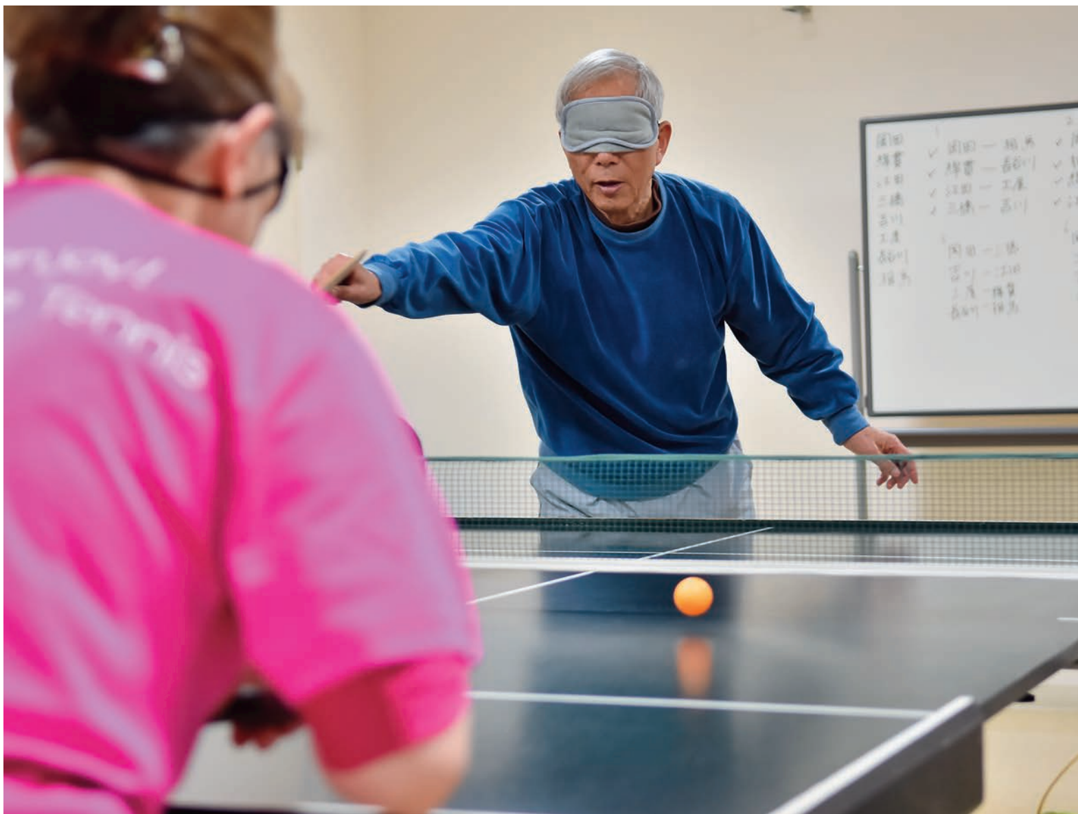
▲昨年、県大会で多数のメダルを獲得した「S T T八千代」の皆さん。勝つことだけでなく一緒に楽しむことも大切にしています

日本人が初めてパラリンピックに参加した1964年の東京大会。当時、障害のある人たちはスポーツどころか外出もままならないような状況でした。それから半世紀あまり、2020年のパラリンピック東京大会では22のpara競技が行われます。今は障害の有無に関わらず、誰でも一緒に楽しめる競技も増えました。サウンドテーブルテニスアイマスクと鉛の粒が入った球を使い、速さや位置を球から出る音で見極めます。最初は距離感がつかめず戸惑いますが、目に頼らないからこそ感じ取れるものがあることに次第に気付きます。スポーツは、体の健康だけでなく、可能性を見いだして自分らしく輝くことで心も元気にしてくれます。