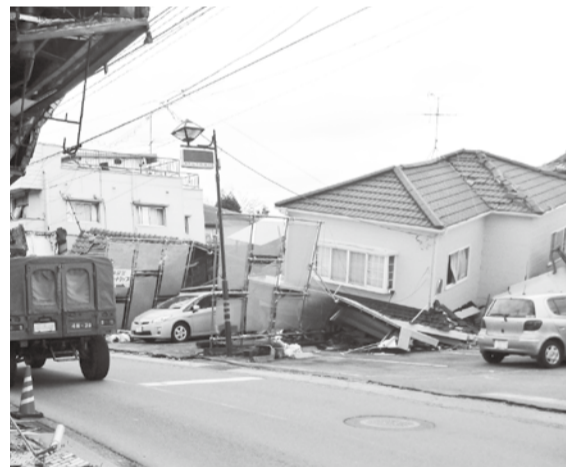
▲1階が押しつぶされてしまった住宅

大地震はいつ起こるか誰にも分かりません。もしものときに備えて耐震診断を行い、必要に応じて耐震改修工事を行うことが大切です。