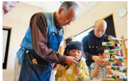
先生から竹笛づくりを 教わりました

堅苦しい場所と思う人もいるかもしれませんが、子どもにも分かりやすく学べるように、体験講座も数多く実施しています。昔の方法で火をおこしたり、勾玉や縄文土器を作ったりして古代人の生活を体験することもできます。竹細工の講座では、ボランティアの人たちが竹を使っ