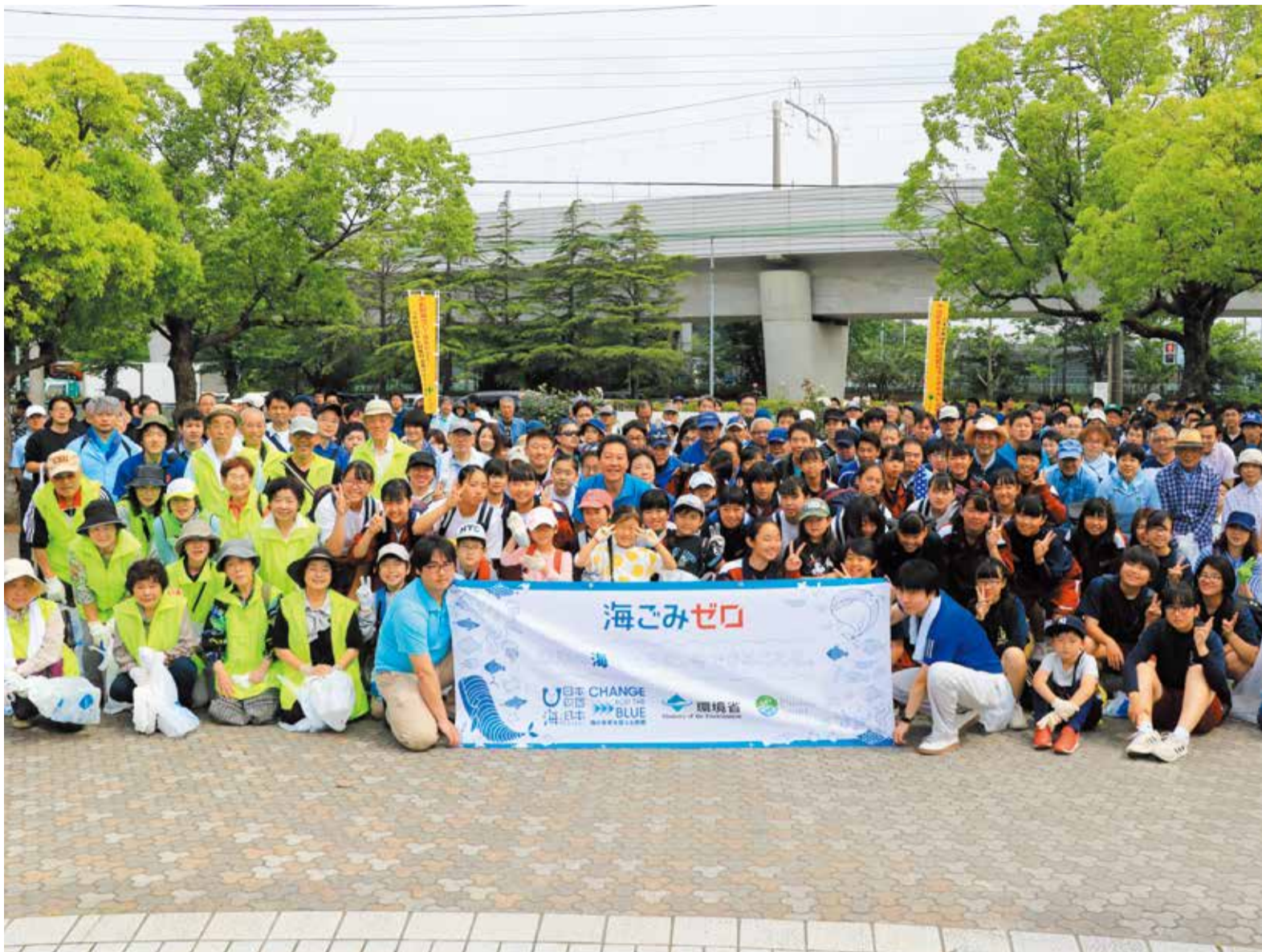
▲総合運動公園に集まった参加者は約600人。海にちなんだ青いものを身につけた人たちも。市内で8,931kgのごみを拾いました

レジ袋・食品トレーなど、今では生活に欠かせないプラスチック。丈夫で便利な反面、自然に戻らず、毎年800万tが世界の海にごみとなって流れ出ています。漂流するうちに、波や紫外線の影響で細くなり5mm以下のマイクロプラスチックになるものも。有害物質が吸着しやすくなり、誤って食べた魚たちへの影響が懸念されています。「海ごみゼロウィーク」は、海の未来を守るため行動しようという取り組みです。海にごみを流さないために街や川をきれいにしようと、全国で約43万人が参加。市も6月2日のごみゼロ運動に併せて実施し、1万2,000人を超える市民が参加しました。今、一人ひとりができることを実行しなければならないときが来ています。