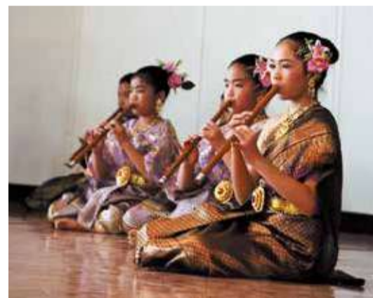
▲自国の伝統文化に誇りを持っています

協力で茶道の作法を学んだり、春バラが満開のやちよ京成バラ園を見学したりしました。