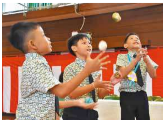
▲昔遊びに挑戦。夢中になって何度も繰り返していました

「ダイラックアン」は、タイで旅の安全や幸せを祈って、手首に巻いてくれる白い糸のこと。自分たちが訪問したときに、心を込めて巻いてもらった感動が心に残っていることから、この名前が付けられました。バンコク子ども親善大