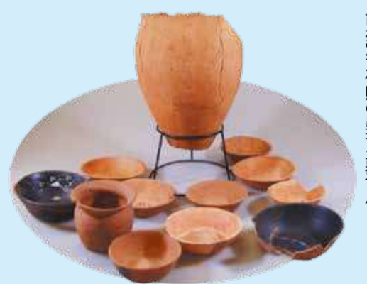
市指定文化財の墨書土器12点

も奈良・平安時代の墨書土器といわれる墨で文字や記号、絵などを書いた土器の出土量が多い地域です。その中でも本市は特に出土量が多く、保品にある上谷遺跡をはじめ、約3,900点見つかり、12点は市指定文化財になっています。この中には、地名・人名・紀年銘・人面などと一緒「召代進上」などの文字が確認できるものも。このことから延命を祈りお供えをするような、祭祀に関わる墨書土器群だと考えられています。