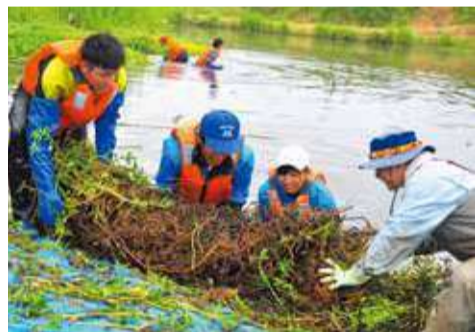
前日の雨を吸って重くなった草を引き上げるのは大変です

県では、平成27年より官学民で連携して、駆除作戦を実施。今年は、6月8日に桑納川で大学生のボランティアなど約100人が参加しました。8月と9月にも行い、繁殖を広げないための、活動を続けます。