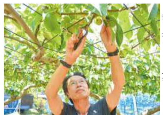
果実は夜のうちに成長します