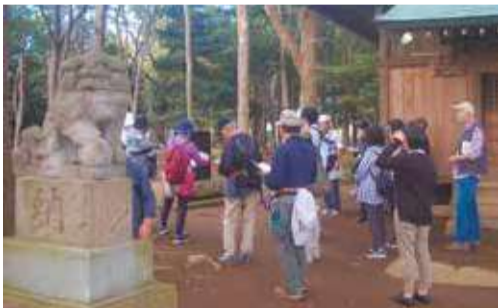
文化財の説明を受けて 間近で見学します

里山を歩いて、その成り立ちや植生の特徴などを調べたり、植物標本を作ったり、文化財や、