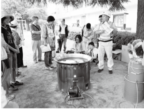
炊き出し訓練で煮炊きレンジの取り扱いの説明を受ける参加者

職場、外出先などで地震から身を守るための「3つの安全行動」を取りましょう。①まず姿勢を低くする（ドロップ）、②頭を守る（カバー）、③動かない（ホールド・オン）を行います。