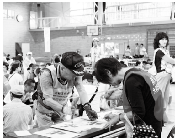
▲避難所開設運営訓練では避難者カードの記入なども

会場は、①勝田台小学校、②大和田小学校、③八千代台小学校、④新木戸小学校の4校です。