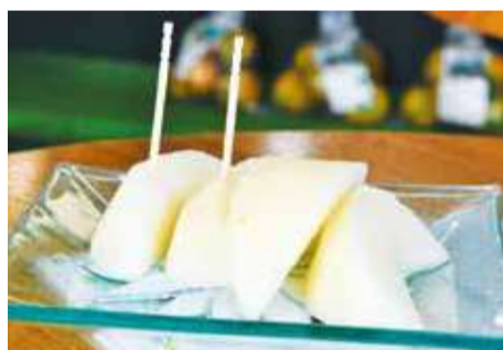
▲もぎたての完熟した梨や珍しい品種を味わえるのも直売所ならでは

「中千代の子どもたちはとても明るく、熱意もエネルギーもあふれています。授業のときだけでなく、間違ってもいいのでどんどん言葉に出して、挑戦してみてください」