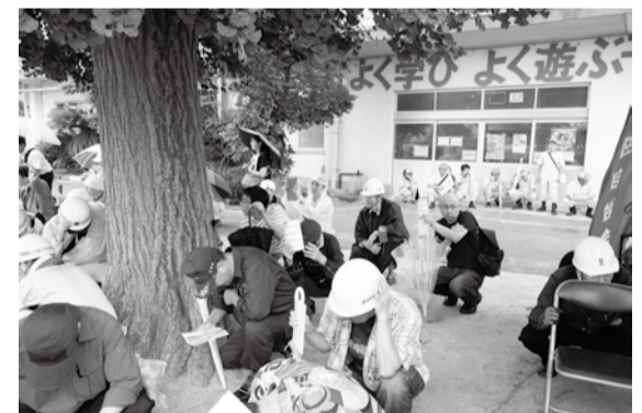
▲シェイクアウト訓練で3つの安全行動を確認

広報広聴課で戦争体験記録集を販売しています 「市民の戦争体験記録集・あの日から」を販売。第一部「八千代・米本空襲」には、昭和20年の米本空襲の記録や証言、第二部「私の戦争体験」には一般公募した、市外での戦争体験記50編を収録。昭和62年発行、800円です。詳しくは同課(483)1151へ。