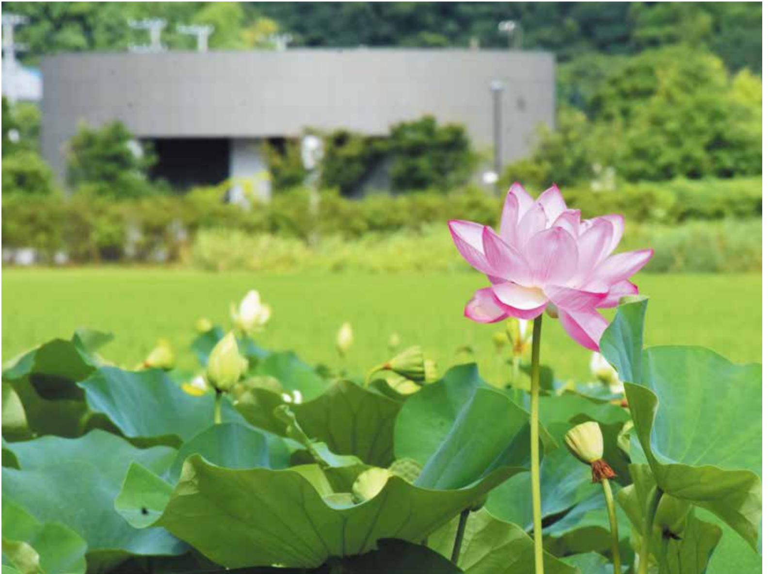
▲美しい花を咲かせるハス。奥に見えるのは、利用開始から10年目を迎えた八千代市営霊園の合葬式墓地

水田など緑豊かな自然に囲まれた八千代市営霊園。昨年のお盆期間には、2,000人以上の人たちが墓参りに訪れました。