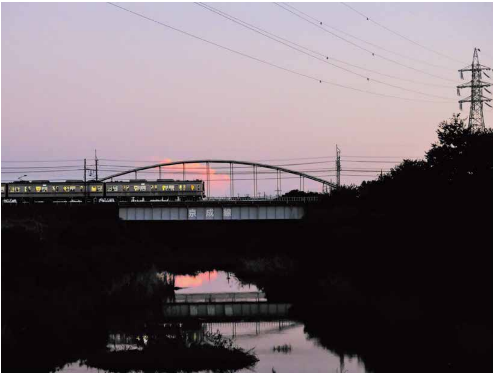
▲私たちの生活に欠かすことができない鉄道は、環境にやさしく安全性も高い交通機関です。大和橋から花見川方面を撮影。

市内に初めて鉄道が走ったのは今から93年前。大正15年、京成大和田駅が開業しました。昭和2年に発行の「大和田町案内図」には、当時は大和田から押上間が56分、運賃は56銭。上下線とも15分間隔で運行したと書かれています。