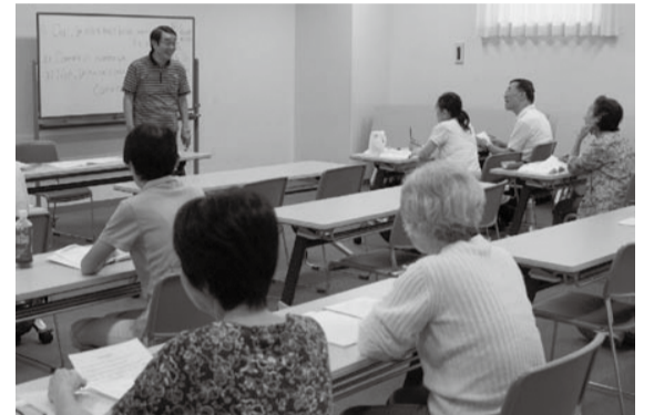
▲主催講座から生まれた「サークルローズ」