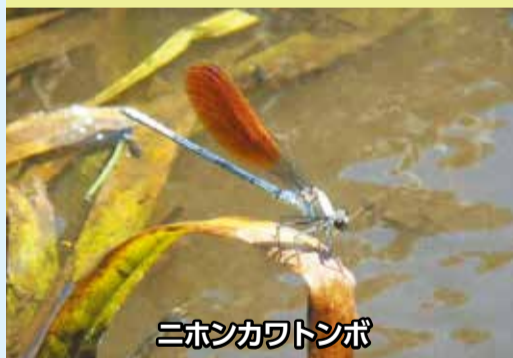
ニホンカワトンボ

河川の上流部や谷津の水路などに暮らすトンボです。今回の調査で、3匹が確認されたことから、市内に定着している可能性があります。