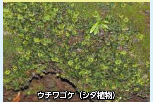
ウチワゴケ(シダ植物)

市内の保存樹木の幹に着生しているウチワゴケを初めて確認しました。県内では数が減少し、県の保護上重要な野生生物とされています。