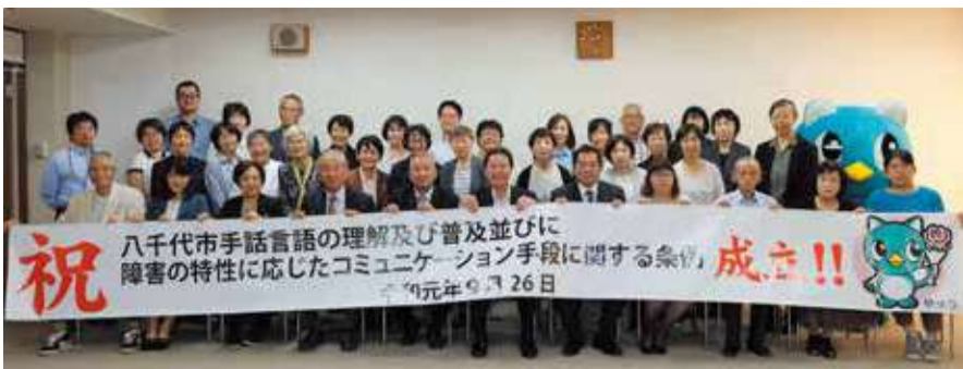
▲条例の制定にご尽力いただいた皆さんと成立を記念して

9月26日、第3回定例会で「手話言語の理解及び普及並びに障害の特性に応じたコミュニケーション手段に関する条例」が可決されました。