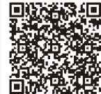
インターネット中継