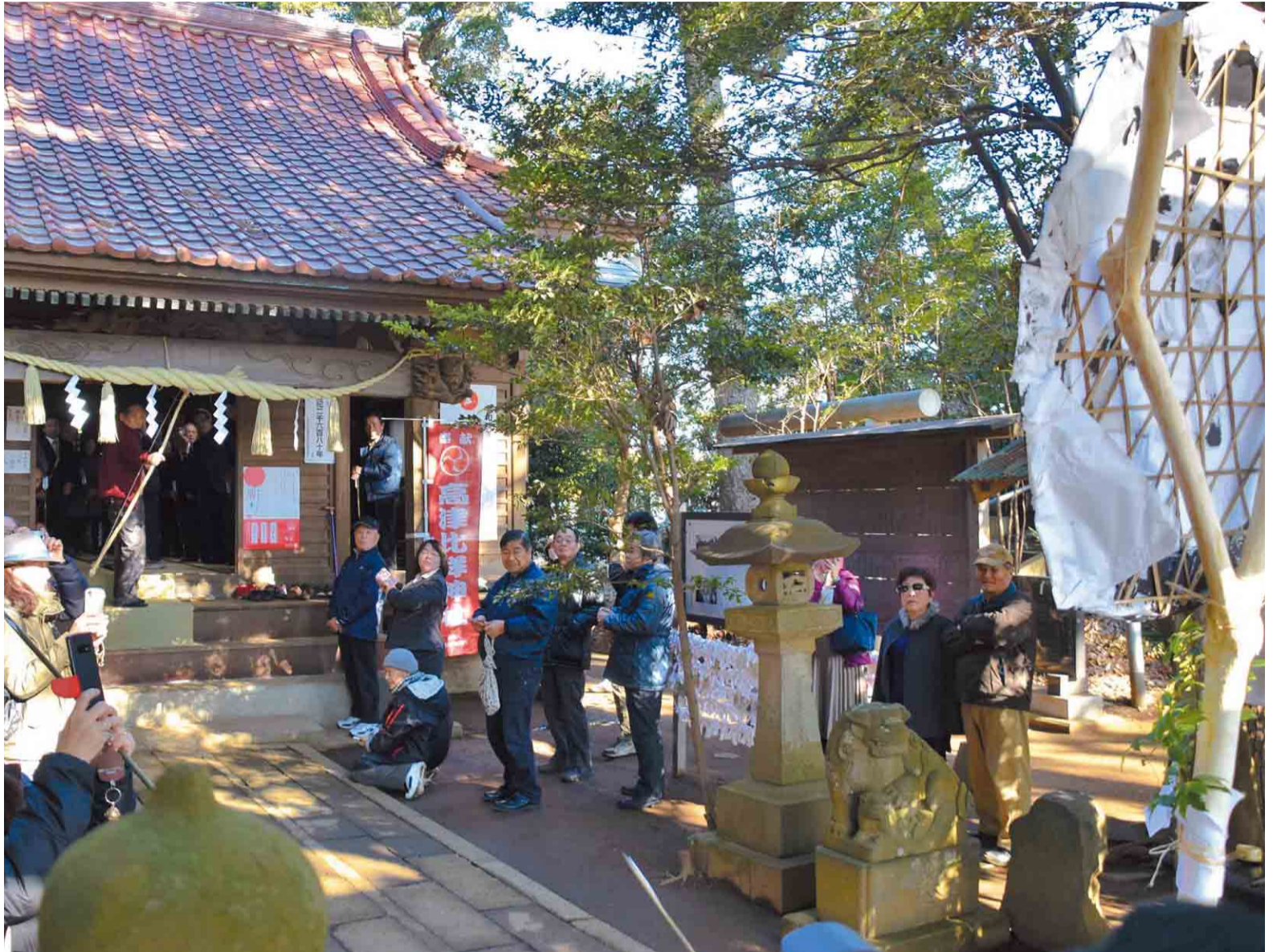
▲今も市内で弓を射る行事が残るのは、諏訪神社で2月11日に行われる「高津新田のカラスビシヤ」とここだけ

“平穏”。時折この言葉のありがたみを、痛感することがあります。それはまるで、日々を当たり前で暮らしている、自分への戒めでもあるかのようにも感じます。1月20日、市指定無形民俗文化財に指定されている、高津比咩神社のハツカビシヤが行われました。天候や作柄を祈願する農耕儀礼と言われるもので「甲乙ム(こうおつむ)」と書かれた的に弓を射ます。文字には、甲も乙もないという意味があり、穏やかな一年を願う先人たちの謙虚で素朴な想いが伝わってきます。