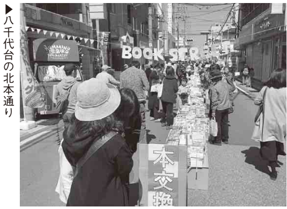
▶八千代台の北本通り

市内最大の本の交換市。現在在庫は3,000冊以上あります。本を3冊持ってくると好きな1冊と交換できます。