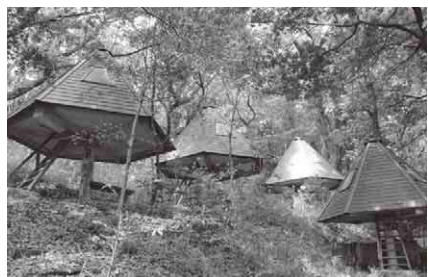
▲自然に囲まれたきのこ型宿泊棟

▶対象 市内に本拠地がある少年 関係団体と引率者。または市内在住 で、中学生以下の子どもがいる家族。 いずれも、20歳以上の引率者がいる こと ▶利用期間 7月1日(水)~10 月31日(土) ▶利用時間 ①宿泊(一 泊のみ) 午後2時~翌日午後1時、