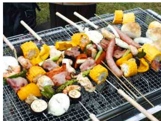
◀充実の設備で手軽に利用できます

3,900円(6人まで。1人追加につき大人600円、子ども300円) ▶申し込み 利用希望日の1か月前から、同センター窓口、ホームページまたはファクス ☎406-4779で ▶問い合わせ 同センター ☎406-4778 (農政課)