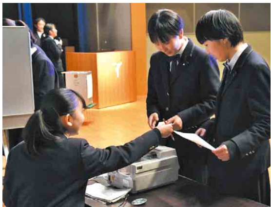
▲投票用紙の交付係も体験しました

本物の投票箱を使った模擬選挙では、3人の候補者の演説と事前に配られた選挙公報をもとに投票しました。「とても簡単に