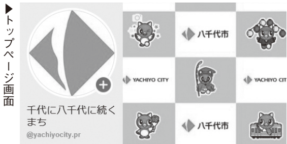
▶トップページ画面

もっとたくさんの人に魅力を伝えていくために、新しくFacebook「千代に八千代に続くまち」を開設しました。