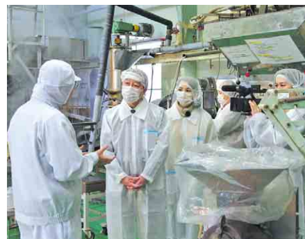
上高野の工場を見学

市長が市内を回り、地域の魅力を紹介する「長々と散歩」。今回は勝田台駅北側の上高野や村上方面を中心に、多文化交流センターなど5か所を回りました。J:COMチャンネル(11ch)で、今日から3月31日(火)まで毎日放送しています。時間は、月曜・木曜・金曜日午前10時30分、火曜・水曜日午後3時、土曜日午後6時30分、日曜日午後9時30分ほか。