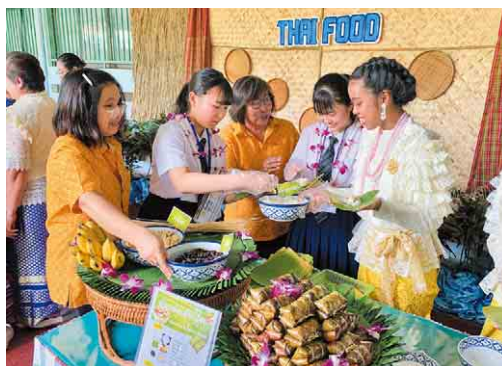
もち米などをバナナの葉で包んだカオトムマツト作りを体験

2月16日の帰国報告会では、お互いの文化を知って認め合うことの大切さを、周囲の人たちにも伝えていきたいと力強く話していました。