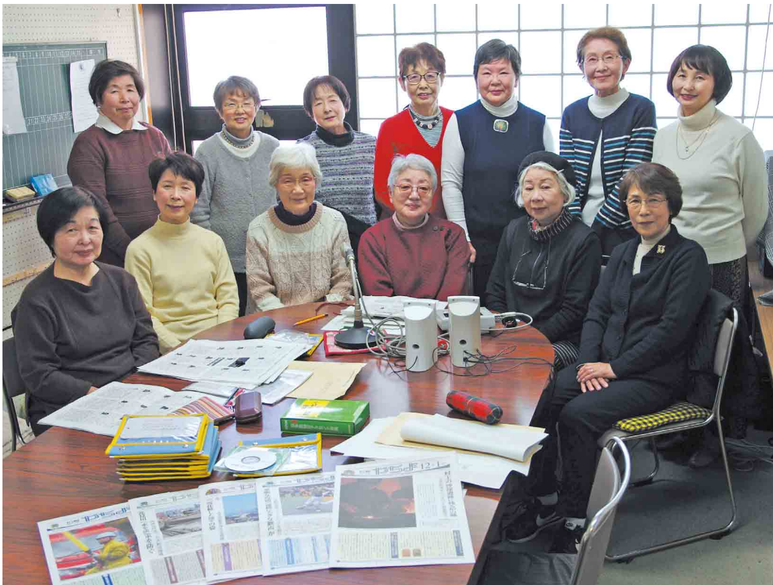
▲福祉センターの録音室で。声の広報やちよの申し込みは、広報広聴課で受け付けています

視覚に障害を持つ人たちに、広報や新聞などの文字を言葉で届ける活動をしている「朗読の会やちよ」の皆さん。声の広報やちよは、40年以上こうしたボランティアの力に支えられてきました。