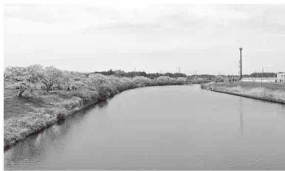
▲新川周辺を活用して活性化を図ります

■ 車両整備事業 高度救命資機材を搭載した高規格救急自動車1台を更新します／4,381万3,000円