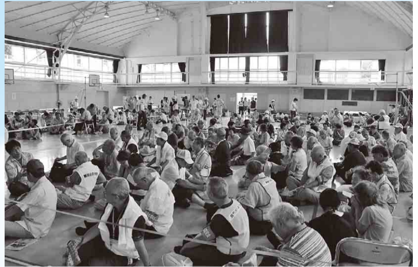
▲いざというときに備え、避難所にもなる学校施設の修繕を早急に進めます

■ 都市公園建設事業 印旛沼流域4市2町による「印旛沼流域かわまちづくり計画」に基づき、水辺拠点と一里塚を整備します／7,966万9,000円