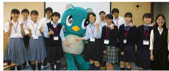
▶昨年度活躍したやっちPR大使