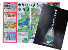
黒い表紙が目 引くパンフレット

やっちPR大使に任命された12人の高校生が、やっちと市のPRを目的に、パンフレット「ゆるいいまちやちよ」と、やっちの新しいイラストデザインを考えました。パンフレットでは、観光スポットや、やっちPR大使のオススメ情報などを紹介。高校生ならではの発想を生かし、同世代の人にも市を身近に感じてもらえる内容になっています。市外のイベントなどで配布するほか、市HPでも見られます。(シティプロモーション課)