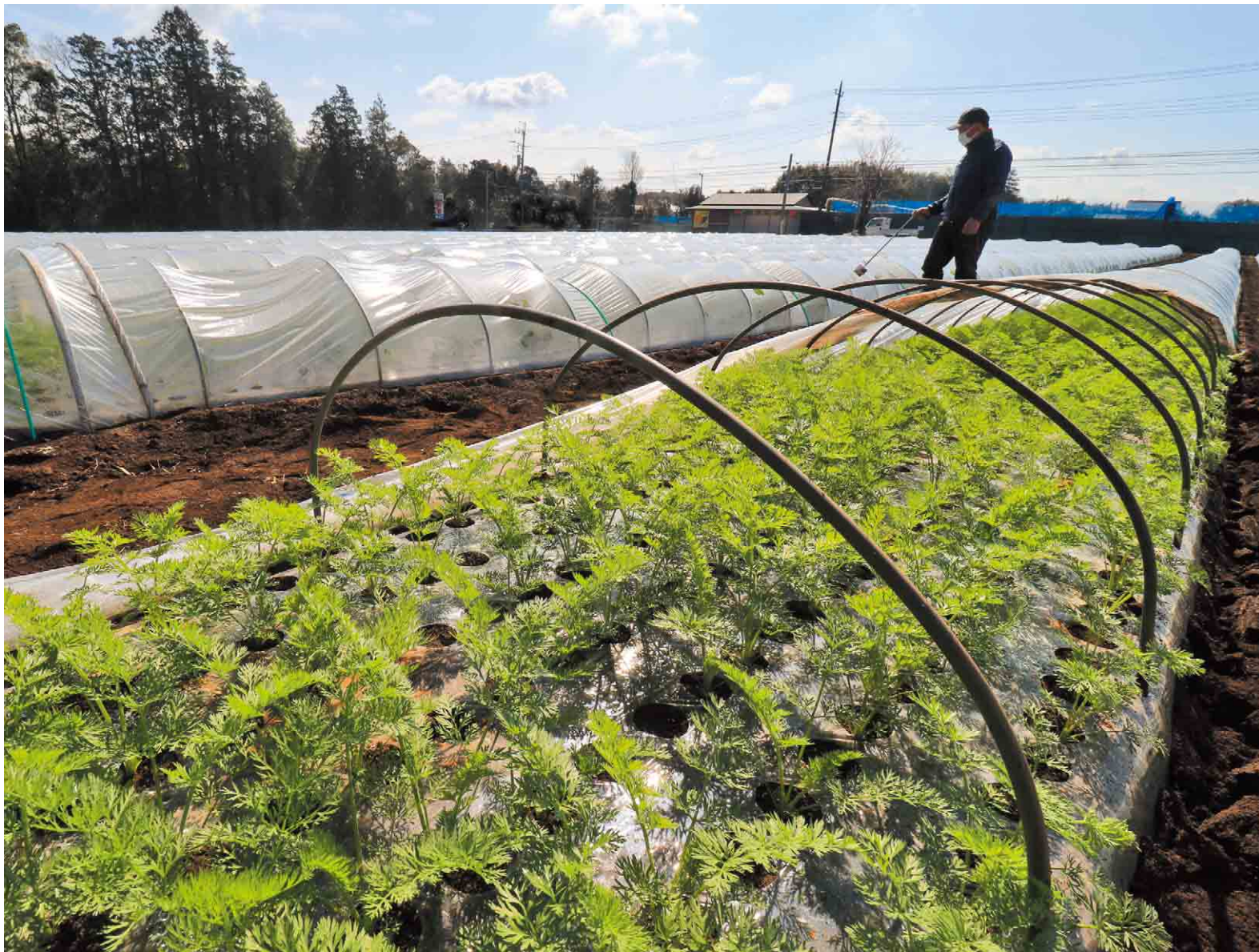
▲雨風から春夏ニンジンを守るために設置されたトンネル。中が暑くなり過ぎないように穴を開けて温度を調整します

鮮やかな色で食卓を彩るニンジン。中でもこれから収穫が始まる春夏ニンジンは、安定した生産や出荷ができているため、国の指定産地にも選ばれています。甘くて軟らかく、サラダなどで食べるとみずみずしさを感じられるのが特徴です。