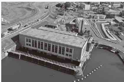
▲上空から見た手賀排水機場