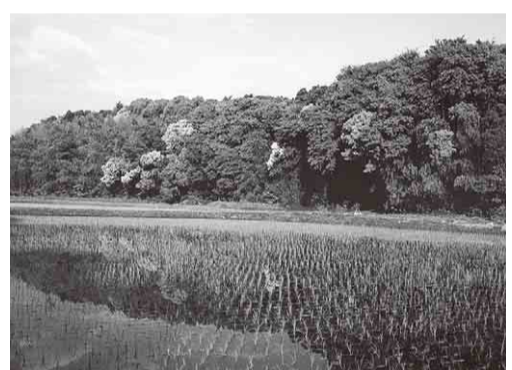
◀地球温暖化防止や環境保全などを推進するため、計画を策定します