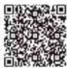
インターネット中継