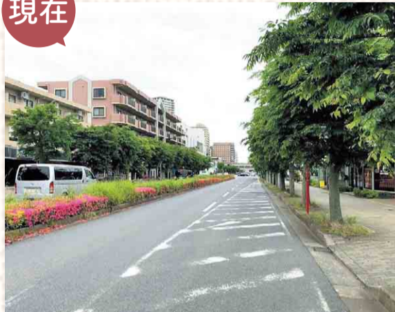
▲街路樹が茂る現在の様子。商業施設や集合住宅が立ち並び、駅舎は、見えなくなっています