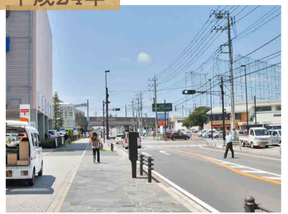
▲県道61号、八千代緑が丘駅前郵便局前。現在では、移転した明治ゴルフセンターが見えます