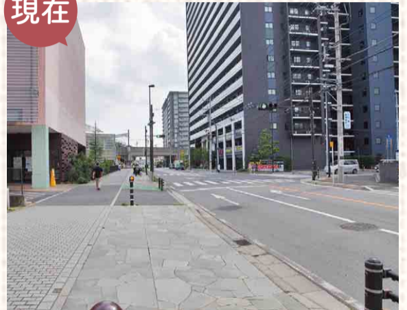
▲高層マンションが立つ現在。新型コロナウイルスの影響で人はまばらですが、普段は多くの人が行き交います