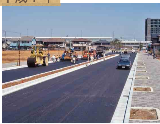
▲駅開業前の公園都市通り。左奥に駅舎が見えます