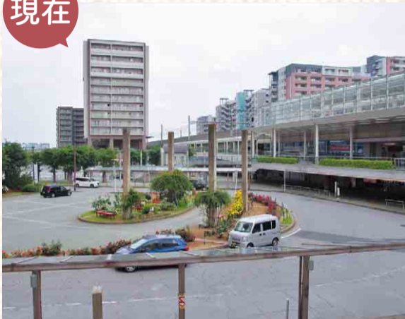
▲平成8年に八千代緑が丘駅として開業。ロータリーの中心は、今号の表紙の撮影ポイントです