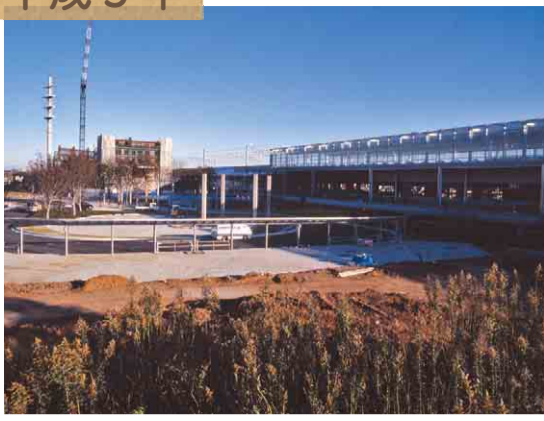
▲工事中の駅北口ロータリー。計画当初は「仮称西八千代駅」でした