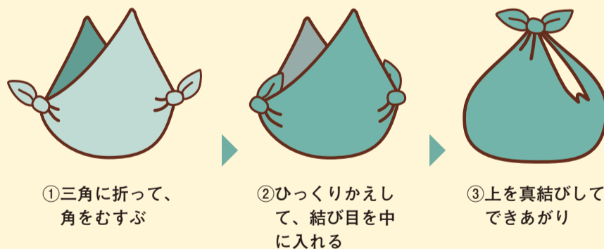
①三角に折って、角をむすぶ

使い捨てではなく、さまざまな柄や結び方があるため、環境に優しく楽しみながら持てるバッグを作ることができます。