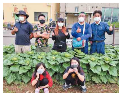
▲大和田BASEの皆さんと駅前広場。日々の成長記録をFacebookで発信しています

子どもたちに地元へ愛着を持ってもらいたい。そんな思いから2月から地域の子もたちと一緒に広場の石拾いや土作りをしてきました。途中、新型コロナウイルスの影響で種まきが延期になるなどもありましたが、現在は苗も順調に成長。8月上旬には見ごろを迎えそうです。