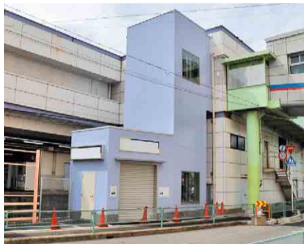
▲設置されたエレベーターの外観