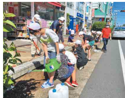
▲東口ロータリーから両サイド350mの花壇に600株のひまわりを植えました

小学生たちは、ボランティアの皆さんが2018年から始めた大作戦に「総合的な学習の時間」の一環として今年初めて参加。これをきっかけに八千代台をより住みやすい街にするためにできることを自分たちで考え、地域や商店街の人たちと協力しながら実践する学習を進めています。