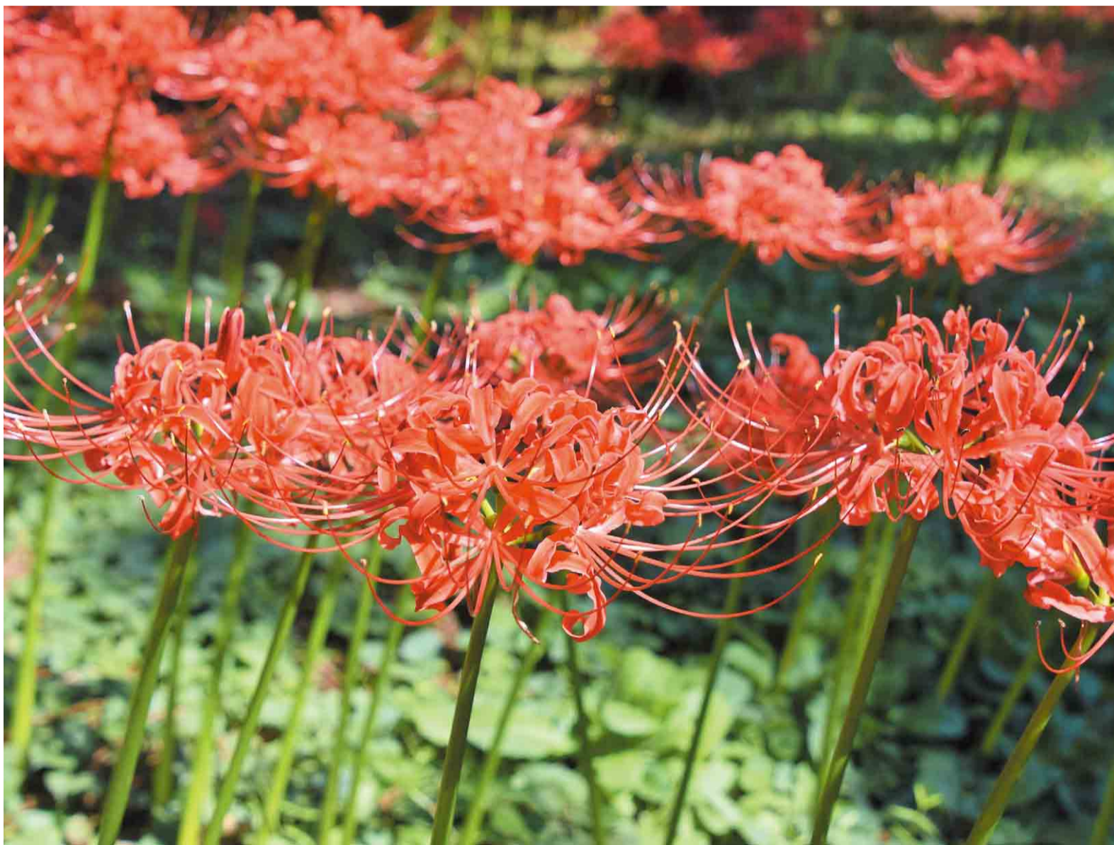
▲昨年10月に撮影。ヒガンバナは別名「曼珠沙華」とも呼ばれています

今年は全国的に記録的な猛暑となりましたが、9月に入り少し暑さも和らぐことができました。これから迎える9月22日は秋分の日。その日を含め前後3日間はお彼岸です。毎年この時期には真っ赤で繊細な形をしたヒガンバナが咲きます。先祖や亡くなった人を供養する、日本特有の風習である「彼岸」に咲く花として知られ、真っ赤な色がこれから始まる色鮮やかな秋への移り変わりを感じさせてくれます。