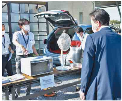
▲一般家庭10日分の電力を賄えます

8月26日、市と千葉三菱自動車販売株式会社、三菱自動車工業株式会社は「災害時における電動車両等の支援に関する協定」を締結しました。災害時に電動車両を派遣して車に積まれた大容量バッテリーから電力を供給します。停電時でも照明や扇風機などの電気製品を利用できます。