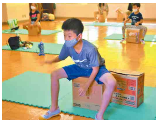
▶ポップな曲に合わせて合奏しました