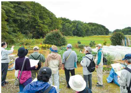
▲奥に広がるのは石神谷津

10月27日は「吉橋地区の歴史と自然を歩く」をテーマに吉橋八幡神社を出発。昭和40年に廃止されるまで睦小学校塙分校として使われていた旧吉橋公会堂や、八福神めぐりのうちの恵比寿が祀られている貞福寺など、解説を聞きながら約3kmを散策しました。