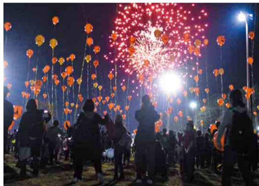
▲環境に配慮し、バルーンはひもでつながれています

10月18日、県立八千代広域公園で開催された(一社)八千代青年会議所主催の「ハロウィンスカイバルーン~みんなの願いを夜空へと!~」。お菓子のつかみ取りやハロウィン工作など、ハロウィンにちなんだイベントでにぎわいました。