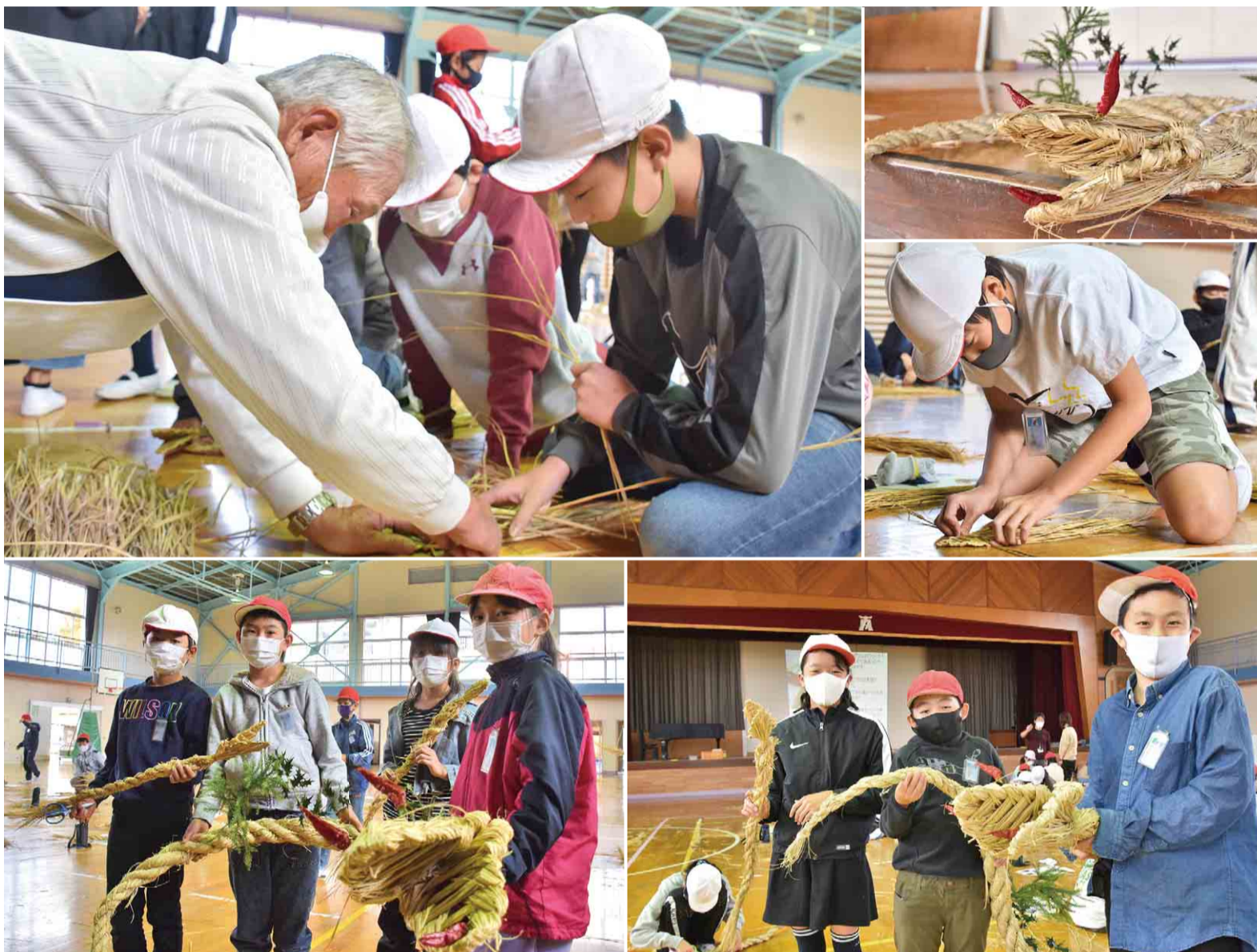
▲大和田南小学校は、2018年にユネスコスクールに加盟。持続可能な社会づくりの担い手を育む教育に取り組んでいます

11月18日、大和田南小学校の5年生が、厄災除けのツジギリで使うワラヘビ作りを体験しました。ツジギリは、外から悪霊や疫病が入ることを防ぐ風習で、集落の境に藁で作った蛇などを飾ります。この体験は、授業の一環で米作りをする同校が、藁の使い道を学ぶとともに、新年を病気せず、健康で過ごせるようにと初めて企画。児童は藁を編みながら、郷土文化に存分に触れました。