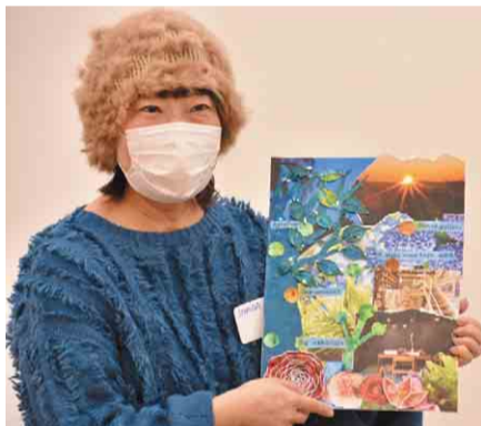
◀ 視覚化することで、夢を潜在意識に刷り込む効果もあります

1月16日、市民ギャラリーで「夢を叶えるヴィジョン・ボード」が開催されました。雑誌や写真などを組み合わせて自分の夢をアート作品にして飾ります。参加者は「もっと人とつながりたい」「うたいたい歌がある」など、願いを感じたままにボードに表現しました。このヴィジョン・ボードには、アートセラピーとしての効果があり、感じたままに表現することで、自分でも気づかなかった心の中が作品に表れ、モヤモヤしている自分の悩みや願望を客観的に見つめることができるそうです。