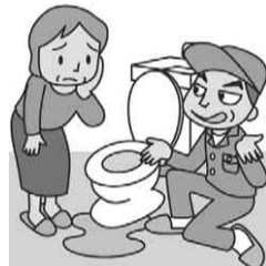
▲消費者庁イラスト集より

「作業が雑ですさん」「見積もりのつもりで業者を呼んだのに、その場で高額な契約を急かされた」などのトラブルが多く見られます。