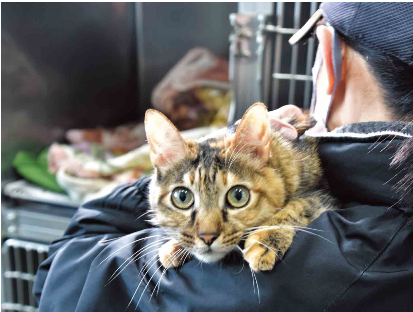
▲県動物愛護センター東葛飾支所に保護された猫。年齢や性格、健康状態などさまざまで、新しい飼い主につなぐことは簡単ではありません

巣ごもり生活が続く中、家庭でペットに癒しを求める人もいます。しかし、安易に飼い始めてしまうと毎日の世話や病気、外出するときの預け先と、手に余ってしまい、手放してしまうなど、ペットにとっても飼い主にとっても不幸な結末を迎えてしまいます。