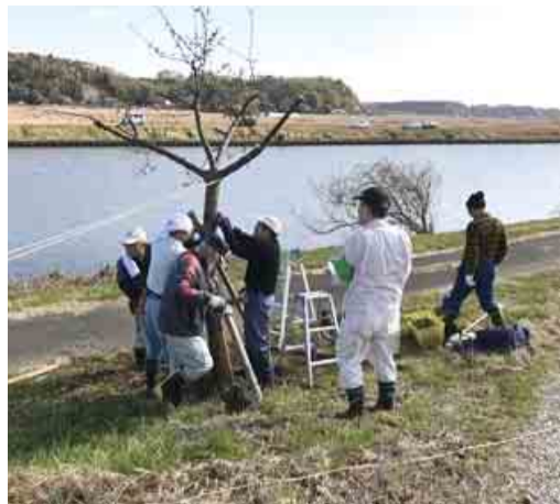
◀ 昨年の台風での倒木を修復しました