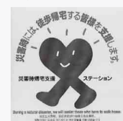
▲コンビニエンスストアなど ▲ガソリンスタンド

八千代台支所とパスポートセンターは2月17日(水)に臨時休業します ユアエルム八千代台店内に開所した八千代台支所とパスポートセンターは、年2回の同店休日に合わせて、今年も、2月17日(水)と9月8日(水)に臨時休業となります。 ▼問い合わせ 八千代台支所 ☎(485)6081・パスポートセンター ☎(485)5801