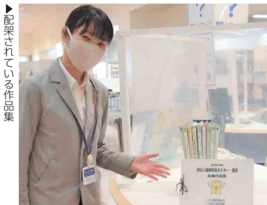
▶ 配架されている作品集

市選挙管理委員会では、昨年5月11日から9月11日まで、市内の児童・生徒を対象に、明るい選挙啓発ポスター・標語作品を募集しました。今年度は、ポスター作品は11校51作品（小学校6校13作品、中学校4校31作品、高等学校1校7作品）、標語作品は9校570作品（全て小学校）