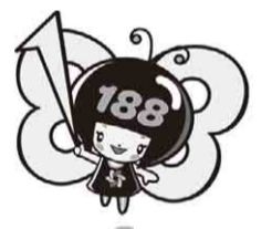
消費者ホットライン188 イメージキャラクターいややん

消費者トラブルで困ったときは一人で悩まずに、全国どこからでもつながる局番なしの3桁の消費者ホットライン188(いやや!)をご利用ください。音声ガイダンスに従って、自宅の郵便番号を入力すると、お近くの相談窓口をご案内します。土曜・日曜日、祝日も、年末年始を除いて、原則毎日利用できます。