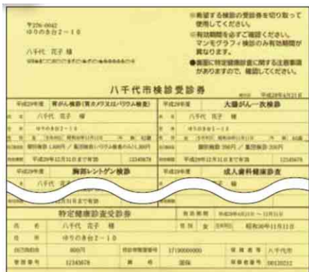
◀今年の受診券はクリーム色です

てから10月末まで、10月～3月生まれの方は8月～4年1月末までです。ただし、保健センターで集団検診を受診する場合は、誕生日に関係なく、全ての日程に申し込みます。