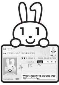
マイナンバーカード イメージキャラクター マイナちゃん