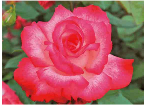
◀前回の東京大会の聖火をイメージして名づけられたバラ

やちよ京成バラ園でスプリングフェスティバル It's so in Bloom! を開催中。1,600品種 1万株のバラが咲く春のガーデンにアート作品と春の草花を楽しむ7つのガーデンが初登場。「香りと光のアート空間」の展示や新作のバラ「ローズ ヌーボ」の展示なども。春の花々が咲く開放感あふれるローズガーデンで癒しのひとときを過ごしませんか。