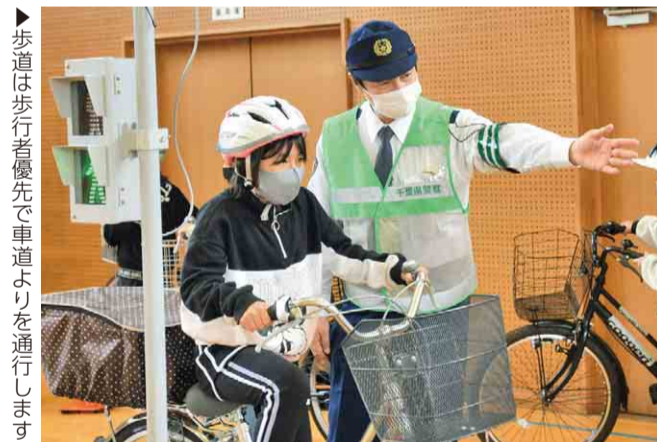
▶歩道は歩行者優先で車道よりを通行します