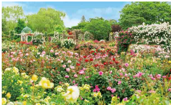
▶1万株を超えるガーデン

品種で、咲き始めは白にピンクの縁取りの花が、日を浴びて燃え上がるように赤くなる様が聖火をイメージさせることから命名されました。日本で作り出されたバラの代表花の一つで、国際コンクールで総合金賞も受賞しています。