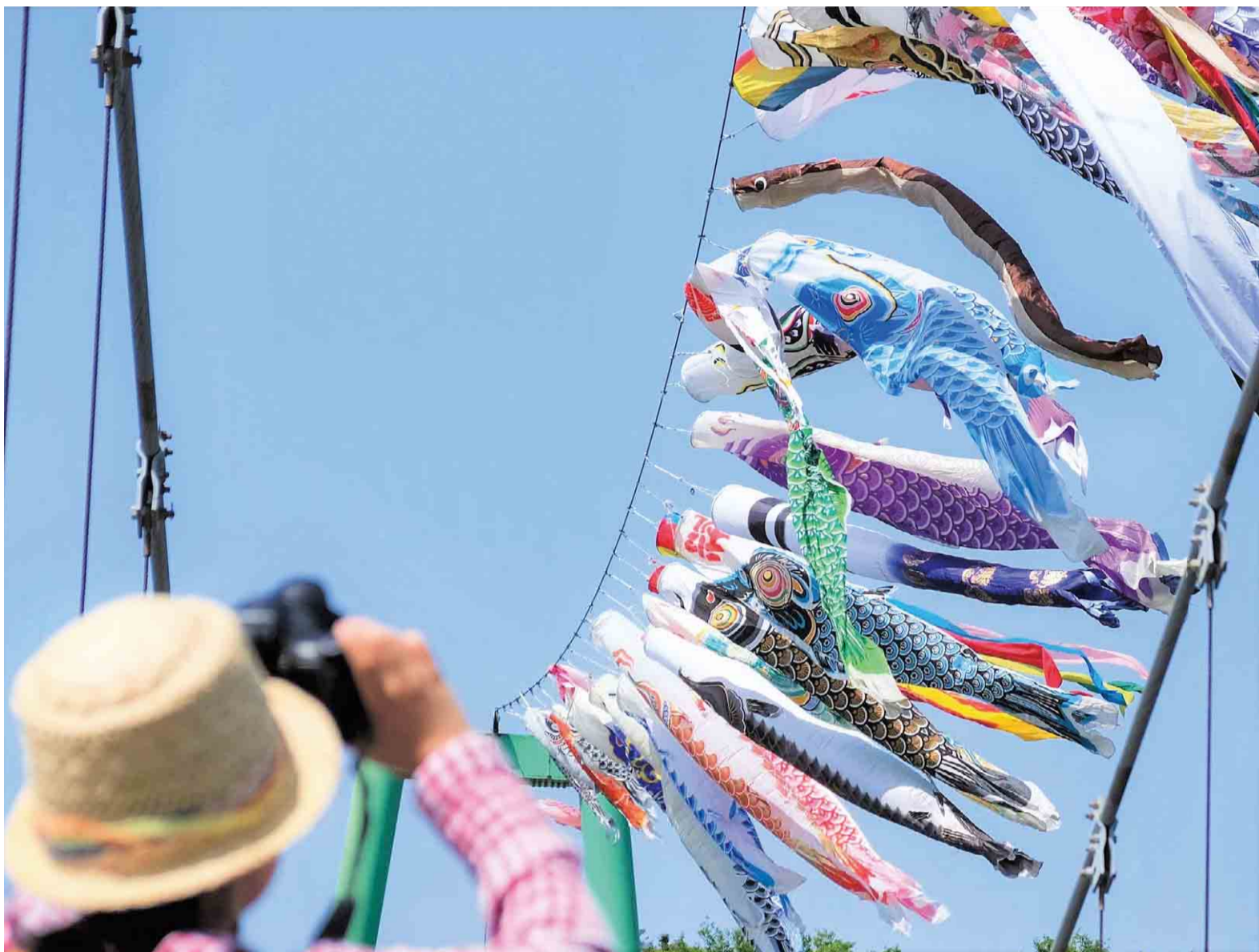
▲こいのぼり大遊泳では、今年も4月29日から5月5日まで約百匹の鯉が泳ぎます。※密にならないように楽しんでください

子どもがたくましく成長するよう、5月5日には生命力の強い鯉を大空に泳がせます。新川の風に吹かれる百匹をよく見てみると、ユニークな仲間が。「あ！うなぎも一緒に泳いでる」。平成15年からお供をしているこの仲間は、景気がうなぎのぼりになって、暮らし向きが良くなるようにとの願いが込められ、愛きょうのある姿をゆらめかせながら、一緒に泳ぎます。