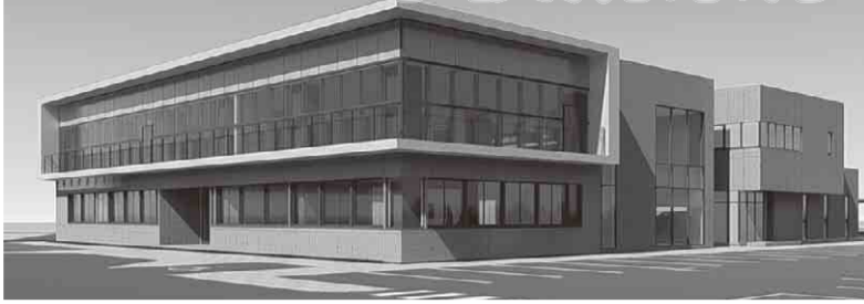
▲増・改築後のイメージ図

市役所敷地内で上下水道局庁舎等を整備するに当たり、3年7月下旬から、来庁者駐車場（市役所庁舎）及び敷地内の出入り口の場所が変更となります。