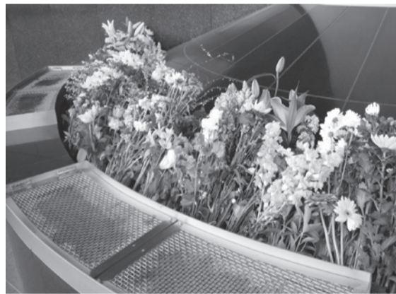
▲合葬式墓地の前にある参拝広場