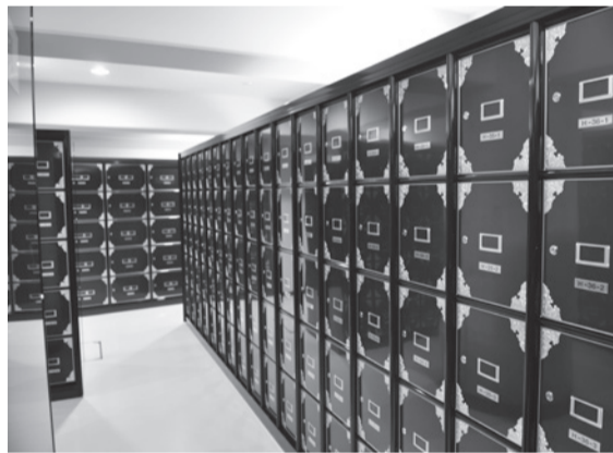
▲漆調で落ち着いた雰囲気の納骨壇

8月13日(金)～16日(月)は、開園時間を午前7時～午後6時30分に変更します。13日(金)～15日(日)は臨時の無料送迎バスも運行します。昨年実施したアンケートを基に、今回から新たに村上・高津団地のバス停を増やし、3コースで運行します。バスの時刻表、乗り場案内図は健康福祉課、市営霊園、支所・連絡所で配布、市ホームページにも掲載しています。