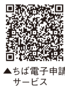
▲ちよば電子申請サービス

■新型コロナウイルスの予約 8月16日(月)と17日(火)の午前8時30分から受付開始。16日は個別接種、17日は集団接種の予約枠を追加します。今回より12歳以上の人の予約を受け付けます。市コールセンター 1☎0570(001)098かWEB申込フォームから申し込みを。次回の予約枠の追加は8月30日(月)31(火)の予定です。 ■新型コロナウイルスのキャンセル待ち 8月12日から集団接種会場の新型コロナウイルスのキャンセル待ちの受付を行っています。申込書の配布・受付を市役所2階福祉総合相談室・支所・保健センター(健康づくり課)で実施。また、ちよば電子申請サービスからも申込みできます。