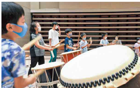
大きざや形などさまざまなた鼓が

合奏では2組にわかれて「ドンッコドッコドン」 「トコドンドン」とかけあい、ラッセラーの掛け声に のせてたたく様子は、お祭りさながらの雰囲気でした。