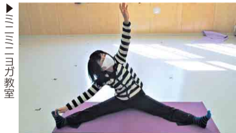
ミニミニヨガ教室

の花火をアートにしている様子が、大和 田公民館では、ちょっとした時間と狭いス ペースでできるミニミニヨガ教室を動画 でわかりやすく配信。そのほか、緑が丘公 民館や八千代台東南公民館では、料理教 室のレシピなど紹介。これからもどんど んアップしていきますので「外に出るのは 不安。でも楽しい体験がしたい」という 人は市ホームページのWEB講座へ。