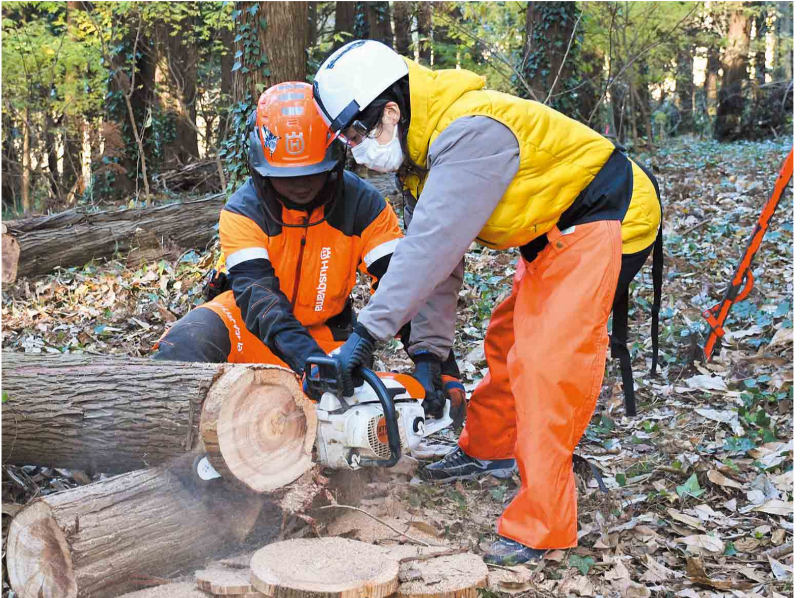
▲里山楽校の屋外実習では、講師から実際にチェーンソーの使い方を学びます

かつて里山は、薪や炭などの資源を調達する場として利用されていましたが、暮らしの変化や都市化などにより利用機会が減り、人の手が入らなくなったことにより荒廃が進んでいます。