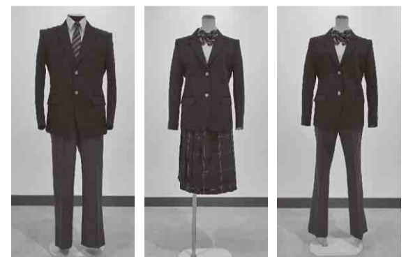
▲新しい奨励服。右はリボンとスラックスの組合せ

3月19日(土)から農業交流センターでバーベキューの営業を開始します 新川のほとり、芝生の広がる「ふれあい広場」で、家族や友人とバーベキューを楽しみませんか。食材は各自でご用意を。 ▼営業日 11月27日(日)までの土曜・日曜日・祝日の午前10時～午後3時 3月19日(土)～4月3日(日)と7月25日(月)～8月31日(水)は平日も営業します ▼費用 1セット6人まで3900円 7人目以降は1人につき大人600円、子供300円が追加でかかります ▼申し込み 事前予約制。利用希望日の1か月前から、直接窓口かホームページ、またはファクスで同センター☎(406)4779へ。お問い合わせ、詳細は同センターホームページまたは☎(406)4778へ (農政課)