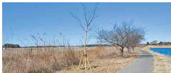
▲補植した新川千本桜の苗木