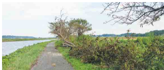
▲台風で倒れた新川千本桜

市では、新川千本桜が桜の名所として相応しい姿を取り戻すよう、今後も引き続き、復旧に向け取り組んでいきます。