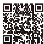
▲5歳~11歳市ホームページ

■予約方法 市コールセンター☎0570(001)098かWEB申し込みフォームから。予約等の詳細な情報は市ホームページを確認してください。そのほか、医療機関での直接予約も受付中。受付医療機関は市ホームページで確認してください。