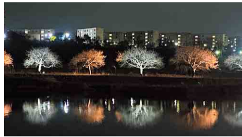
▲暖色と白色のライトが交互に点灯

新川の河津桜ライトアップが2月26日から行われました。 今年は、環境負荷に配慮し、電源をガソリン発電機などから、太陽光発電機などの自然エネルギーに切り替えました。これは、かつてないほどの強風で千本桜が倒れた元年の台風から、実行委員会が気候変動に危機感を持ち、地球温暖化対策に取り組んだものです。 寒さの影響で、初日には開花に至りませんでしたでしたが、エコな明かりで照らされ、開花しているかのような河津桜が水面に映りました。