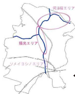
◀メインとなる3品種の植栽エリア

新川千本桜では8品種の桜が植えられていますが、今回、復旧工事を実施した3品種をご紹介します。