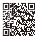
▲療養を証明する書類