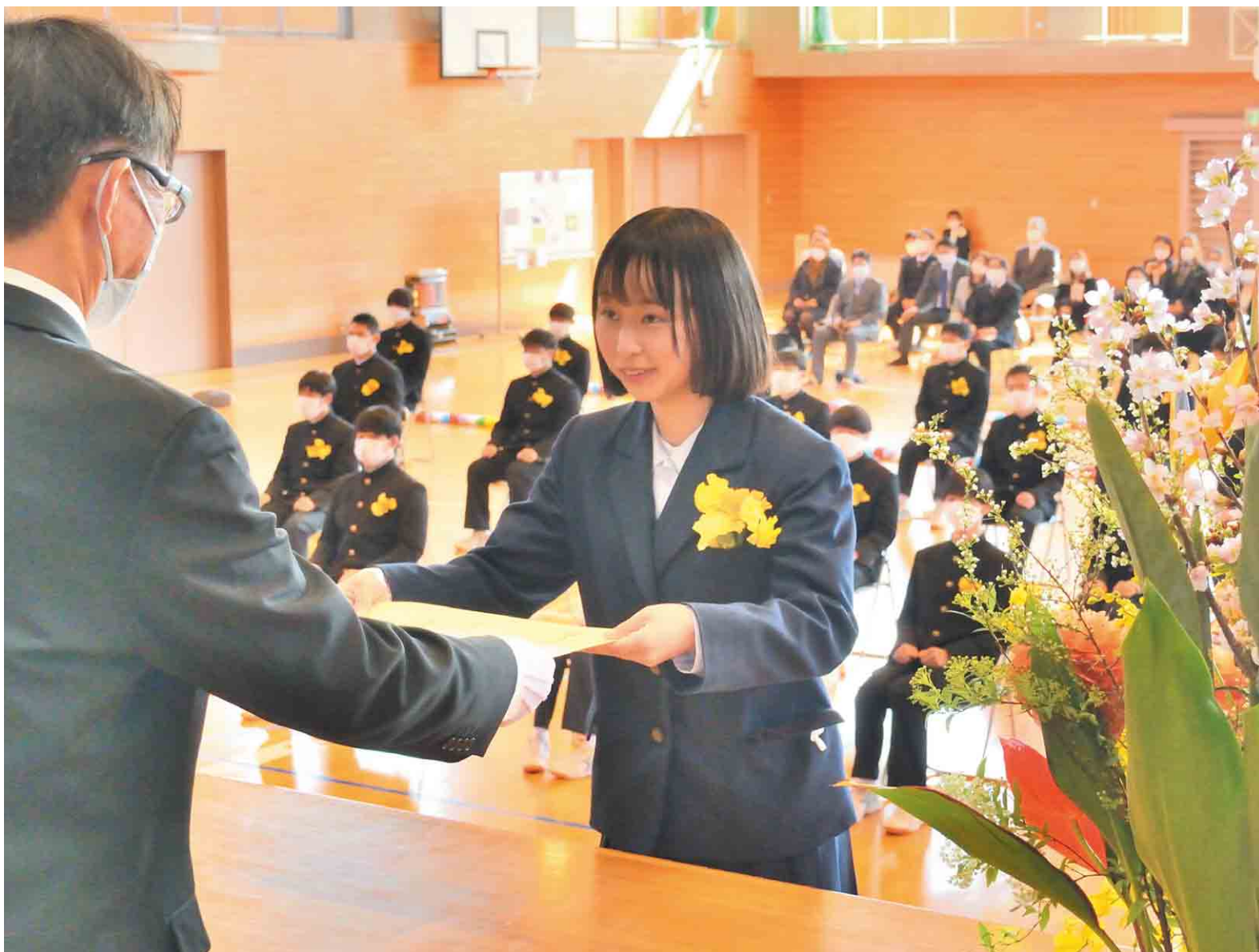
▲感謝を胸に、卒業証書を授かりました。※登壇するときだけマスクをはずしています

昭和22年に創立された阿蘇中学校。75年の間に9,130人の生徒が学校生活を送り、巣立っていきました。3月9日には43人の最後の卒業生を送り出し、阿蘇中学校としての歴史を終えました。