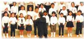
八千代市立米本小学校