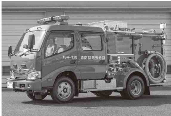
▲2月27日に更新した第5分団のCD-I型