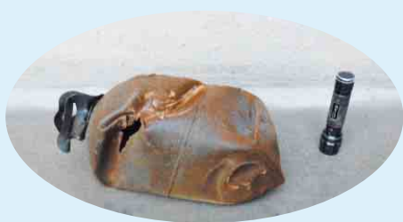
長さ約40cm、重さ約10kgありました

可燃物の中にこのような不燃物や危険物が混入していると、収集時の事故や焼却処理施設の緊急停止の原因となり、収集や処理の遅れにつながりますので、正しい分別にご協力をお願いします。