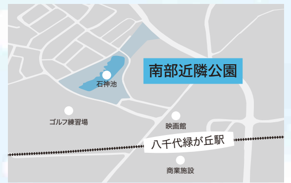
▲整備予定の南部近隣公園（緑が丘西2丁目地先）

また、八千代市空家等対策計画に基づき、空家の利活用を促進し住環境の保全を図るとともに、移住・定住並びに地域の活性化を促進するため、空家バンクに登録された住宅を購入した人に対して、リフォームに要する費用の一部を補助します。