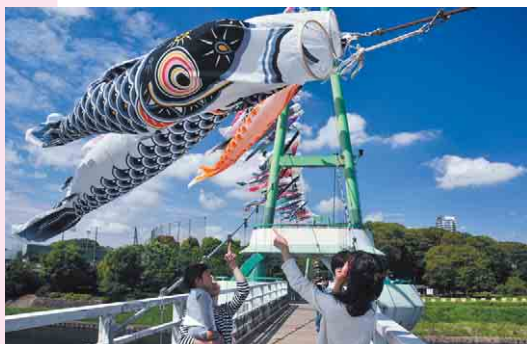
力強く大空にはためきます

▶こいのぼり寄贈のお願い こいのぼり大遊泳で使うため、家庭で使わなくなったこいのぼりの寄贈をお願いします。※付属の金具類は受け取れません ▶寄贈先 八千代台東南公共センター1階八千代商工会議所内八千代ふるさと親子祭実行委員会か市役所商工観光課観光推進室へお持ちください ▶時間 平日の午前9時～午後5時 ▶問い合わせ 同実行委員会 ☎483-1771、商工観光課観光推進室 ☎421-6762