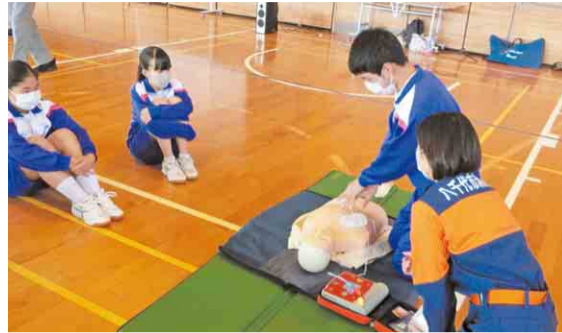
▲旧阿蘇中学校の生徒が消防職員からAEDを使った救急救命講習を受講している様子

市内の中学校では、災害が起きたとき、それぞれのコミュニティで中心を担う学校・生徒となれるよう、地域へ貢献できる生徒の育成を目指し、防災教育にも力を入れています。