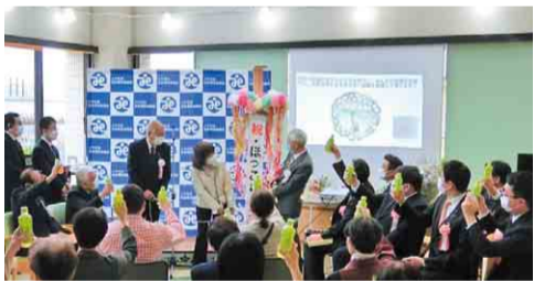
▶オープニングセレモニーも開催されました

ほっこりはみんなの居場所として、相談の場として、地域の人や団体をつなげ、地域課題の解決に取り組んでいきます。