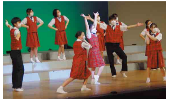
▲立って歌うイメージがありますが、振り付けのついた演目はダンスをするなど、かなり動きがあります

八千代少年少女合唱団は、今月22日に市民会館で行われるチャリティー事業のウクライナ支援コンサートにも参加を予定。市の代表として歌声を響かせます。