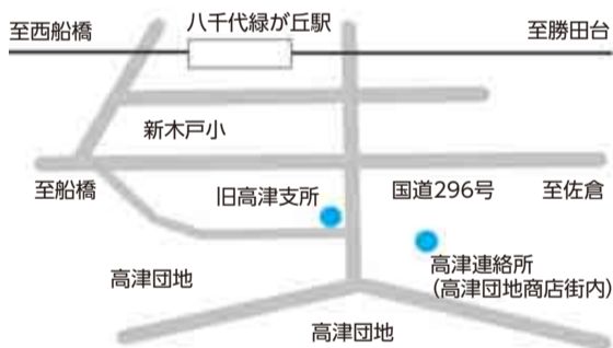
▲高津連絡所の位置

開所時間は、市内の支所・連絡所と同じく、土曜・日曜日、祝日、年末年始を除く午前8時30分～午後5時です。車で来所する場合は、高津団地商店街駐車場をご利用ください。