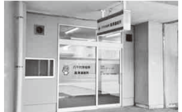
▲高津連絡所の外観