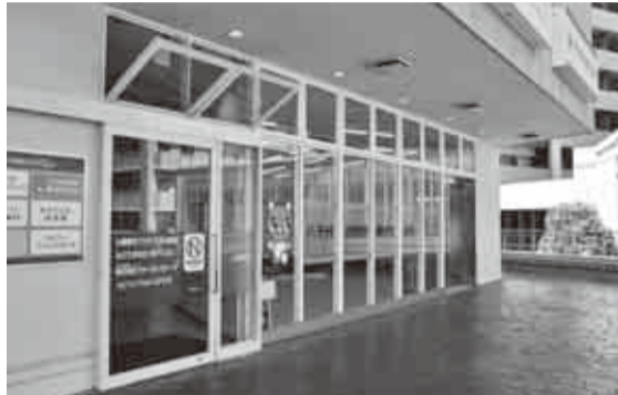
▲写真左の扉からお入りください