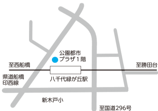
▲緑が丘支所の位置

車で来所する場合は、公園都市プラザ敷地内駐車場または県道船橋印西線を挟んで向かい側のタイムズ八千代緑が丘駐車場が利用できます。支所を利用した場合は、駐車料金が2時間まで無料となりますので、駐車場の発券機から発券される駐車券を持ってください。