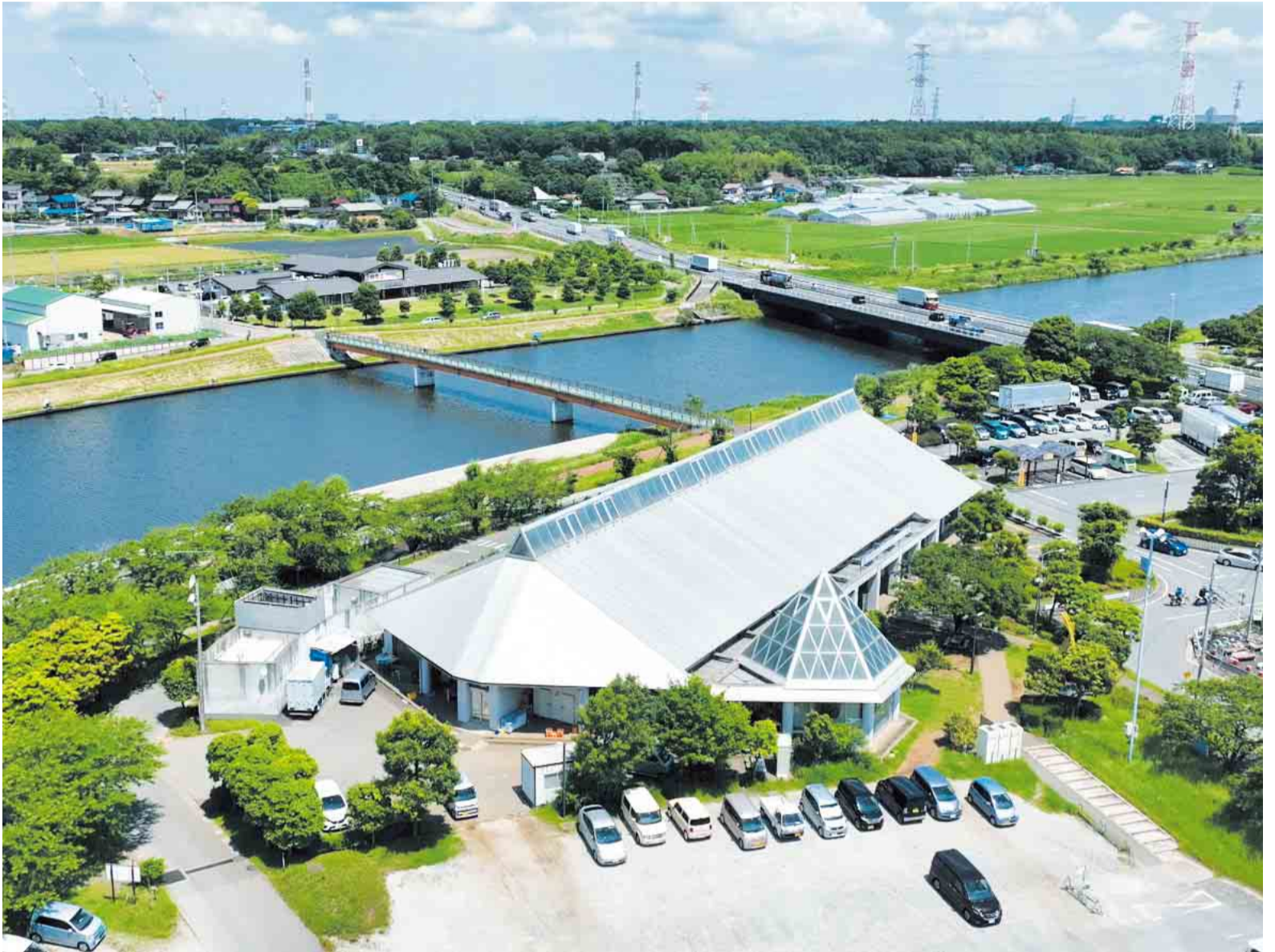
▲道の駅やちよは、国道16号線や新川サイクリングロードに面しており、広域からの利用者を受け入れています

道の駅やちよが開設から25周年を迎えました。平成25年には対岸にやちよ農業交流センターを開設し、農業体験や本市で収穫されたおいしい農作物の販売等、食にまつわる体験を提供することで、市民の皆さまから愛される人気の施設に成長しました。