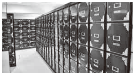
▲漆調で落ち着いた雰囲気の納骨壇

使用料は、管理料を含め税込みで1体用11万円、2体用22万円で、利用許可時に一括払