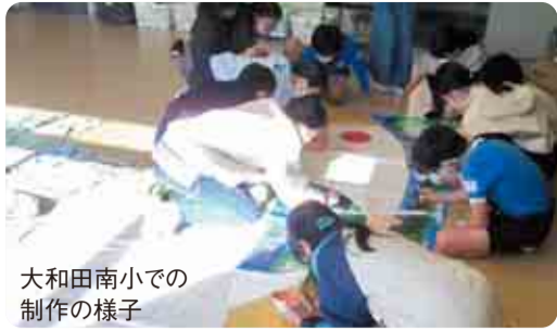
大和田南小での制作の様子

SDGs (Sustainable Development Goals 持続可能な開発目標) は、2015年に国連で採択された、世界共通の目標のことです。2030年までに、17の目標と169のターゲットを達成しようというものです。「誰一人取り残さない」という理念のもと、未来も含めて、地球上に生まれた誰もが、自分らしく幸せに暮らし続けることを目指しています。お問い合わせは教育委員会指導課 電話481-0301へ