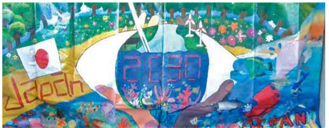
▲大和田南小学校6年生と台湾の児童が協働して1枚の絵を完成させました

地域と世界を関連付けながら共通の課題を発見し、多様な文化背景を持つ人たちと協働して、より良い解決策を探る力や、新しい価値を生み出す力を育てています。