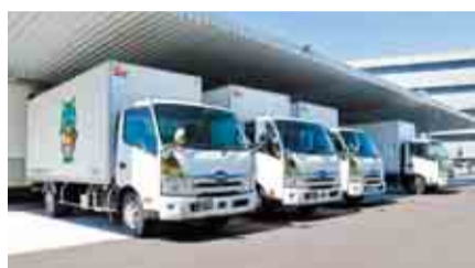
▲調理場の裏手にある搬出入口

同調理場は、一日約6,000食の調理能力があり、市内12校の小中義務教育学校に給食を提供します。また、食物アレルギー専用の調理室を整備し、平成