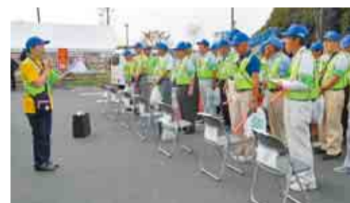
◀過去に行ったふるさと親子祭り警備の出動式

防犯指導員として活動するためには、同会に加入している自治会長からの推薦が必要です。「自分たちの地域は自分たちで守る」という共助の取り組みが大切ですので、防犯活動に興味のある人は、ご相談ください。地域内の活動を通じて、安心・安全な住みよいまちづくりにぜひ参加してみませんか。