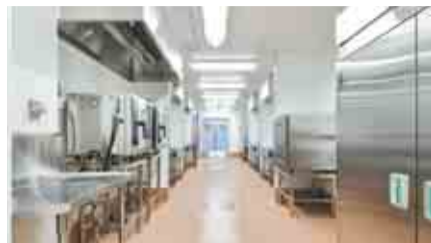
▲食物アレルギーに対応した調理室