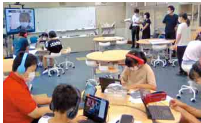
◀タブレットを使って英語で交流します

た。新型コロナウイルスの影響で、行き来が難しくなりましたが、生徒同士の交流はオンラインで続いています。3年度は、睦中学校3年生の生徒が、1年間に2回、ヒルグローブ校の生徒たちと交流しました。好きなスポーツや、キャラクターや漫画の話、お互いの国に関するクイズを英語で出し合いました。今年度も、3年生の生徒がオンラインで交流する予定です。 (指導課 ☎483-0301)