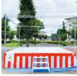
◀やぐらにはクレーちゃんのシールが貼られています

宝くじの社会貢献広報事業として、宝くじの受託事業収入を財源に実施しているコミュニティ助成事業。米本団地自治会では、この宝くじの助成金を活用して、お祭りやイベントで使うやぐらを購入しました。