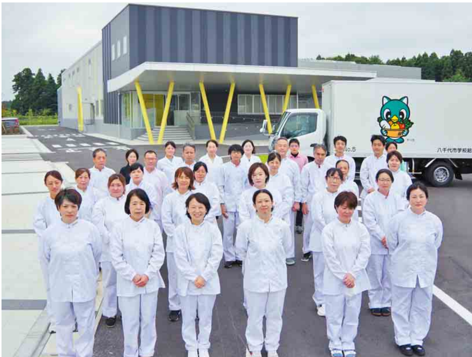
▲食品の安全や衛生管理に細心の注意を払い、施設を運営していきます。東八千代調理場の詳細は5ページに掲載しています

保品に学校給食センター東八千代調理場が完成。新学期から小・中学校と義務教育学校12校に給食の提供を開始します。