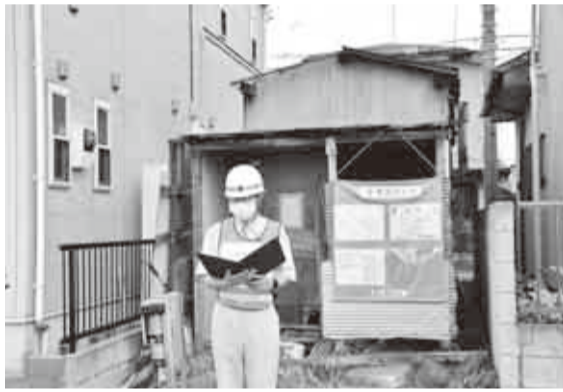
▲代執行宣言をする本市職員