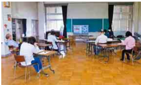
▲危機管理課の防災講座の様子