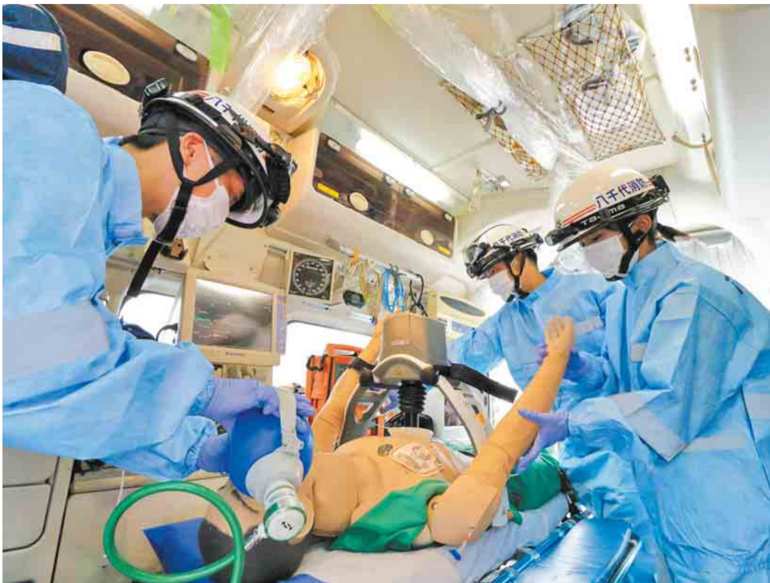
▲新型コロナウイルス感染症対応地方創生臨時交付金を活用して整備した自動心臓マッサージシステムの運用訓練の様子

新型コロナウイルス感染症の感染者が急増した7月は、救急車の出動件数が昨年と比べ約1.3倍となり、医療機関のひっ迫から、受け入れ先の病院が決まるまでに時間を要することがありました。一人でも多くの命を救うために、明らかな軽いけがや症状の場合は、安易な通報は控えてください。判断に迷うときは、県の救急安心電話相談(#7009)やこども急病電話相談(#8000)を活用しましょう。