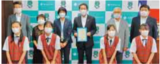
▲県ユニセフ協会福本事務局長（中央左）、服部名誉会 長（中央右）、同実行委員会代表者の皆さま

公益財団法人日本ユニセフ協会から、市ウ クライナ支援事業実行委員会に対して感謝状 が贈呈されました。この感謝状は、同実行委 員会が4月と5月に行ったウクライナ支援事 業の収益金のうち150万円を、募金として同協 会に寄附したことに對するものです。