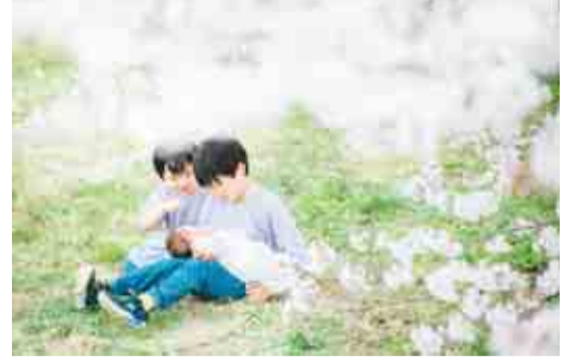
▲生まれたばかりの弟を抱っこする兄弟の写真です。 豊かな自然や春を感じられる作品が入選しています