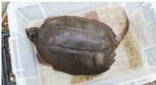
◀ 捕獲されたカミツキガメ

特定外来生物は、平成17年に施行された外来生物法によって飼育や運搬、譲渡、野外に放すことが原則禁止されています。