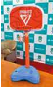
▲寄贈されたミニ バスケットゴール

本市と包括連携に関するブー ースタウン協定を締結して いる株式会社千葉ジェッツふ なばし様より、連携事業の一 環として、「幼児用ミニバス ケットゴール」を寄贈いた だきました。希望する保育園・ 幼稚園の計42園に配布し、有 効に活用いたします。