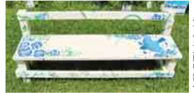
▲八千代台西中制作

げられたデザインは、市の花「バラ」や梨 などが描かれており、訪れた多くの人の目 を楽しませています。