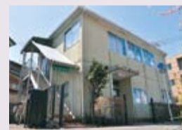
▲市民会館向かいのフリーパレット