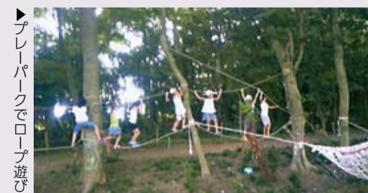
▶プレーパークでロープ遊び

総合運動公園野球場隣接地にあります。「自分の責任で自由に遊んでみよう」をモットーに豊かな自然環境の中で冒険遊びができます。雨天でも開園。申し込み不要で、費用は無料です。