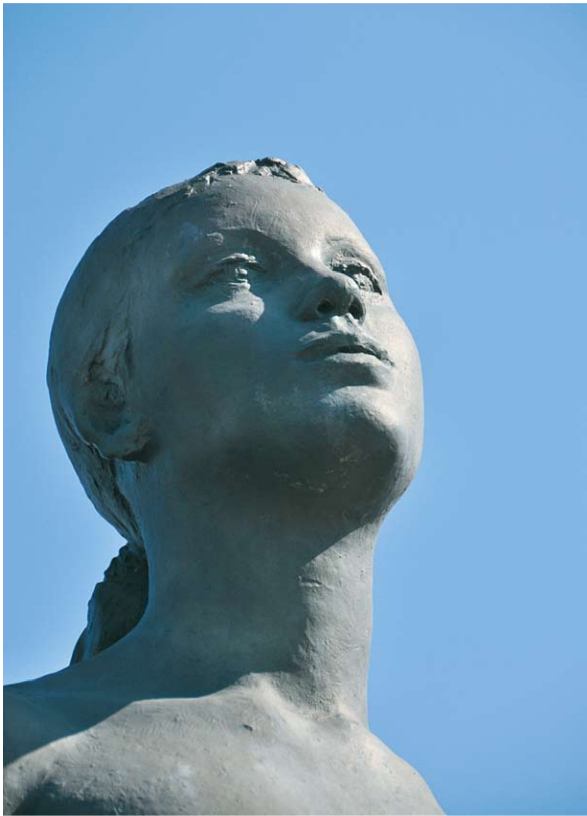
▲日の光を浴びる「太陽」の像。「ブロンズ像と村上橋」は「八千代ふるさと50景」に指定されています

市の中央を流れる新川は、水辺のネットワークゾーンとして整備が進められ、村上橋はその中心となる場所にあります。「橋にブロンズ像を」という市民運動により、昭和56年の架け替え時に、彫刻家の故佐藤忠良さんが制作したブロンズ像が設置されました。手をあげて躍動的な感じの「緑」と、手を下げて静かな姿を見せる「太陽」が安らぎと潤いの空間を作ります。太陽は、お天道様とも呼ばれ信仰の対象にもなりました。その光は、植物や動物の成長を促し、太陽光発電として暮らしを支えるエネルギーにもなります。毎日変わらず私たちに恵みを与えてくれる太陽。5月21日の金環日食では新たな魅力を見せてくれるでしょう。