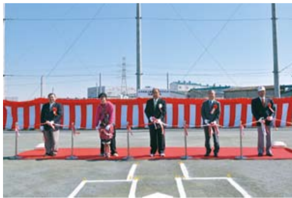
▲青空の下で、完成記念のテープカット

このグラウンドは、スポーツを促進し市民の交流を深めることを目的に作られたもの。少年野球以外にも、少年サッカー、グラウンドゴルフ、ソフトボールなどができます。メンバーの3分の2以上が市内在住または在勤・在学の人で構成されている団体に貸し出します。事前に利用団体の登録が必要です。詳しい利用方法は、文化・スポーツ課☎481-0305へお問い合わせを。