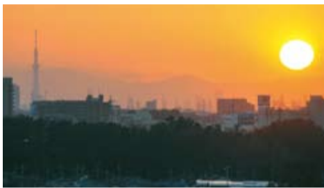
▲夕焼けの空に映える東京スカイツリー

天気の良い日に、5月22日(火)オープンの東京スカイツリーが見えます。(4月4日、八千代台地区で撮影)