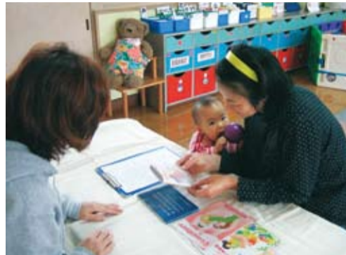
◀身近な地域子育て支援センターで申請できます

▶交付場所/時間 地域子育て支援センター/午前9時～午後4時、子ども支援センターすてっぷ21/午前9時～午後5時、保健センター