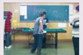
▲ビリヤードもできます