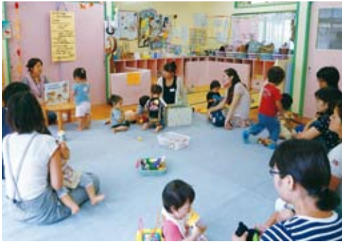
▲セジュンベ1歳半おやこ広場では、わらべうた遊びや食事の話なども

身体計測、育児相談、離乳食や発達の日安、子育てのワンポイントなどのお話、遊び場や手遊びの紹介などを行います。お母さん同士の交流もあります。