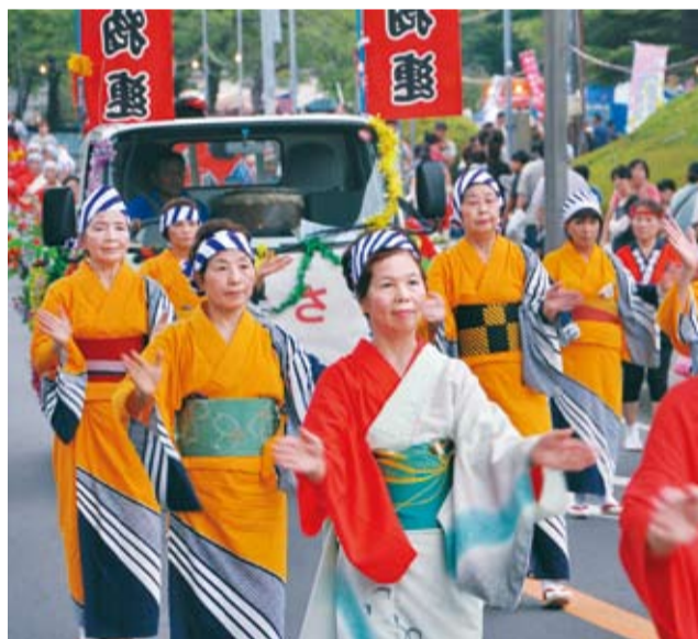
▲村上橋通りでは舞踊パレードがにぎやかに

翌12日の早朝には大雨にもかかわらず市民ボランティアなど885人が清掃を行い、1万580キログラムのごみが集められました。今回は萱田中学校、大和田中学校の生徒も参加。雨のなかでの作業になりましたが、ペットボトルやびん・缶の分別などに大活躍でした。