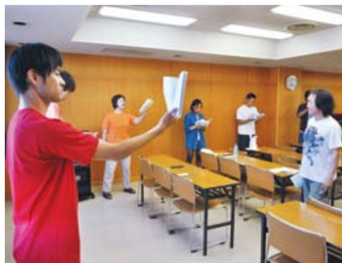
▲セリフの息つぎは鼻から吸うのがコツ

次代を担う演出家の養成講座として文化庁と日本演出家協会が主催する「演劇大学in千葉」が8月2日～5日、八千代台東南公共センターで開催。八千代市出身の演出家が中心となって、講演会やワークショップなどを行いました。