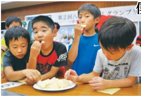
▲予選を勝ち抜いた梨を頬張り審査