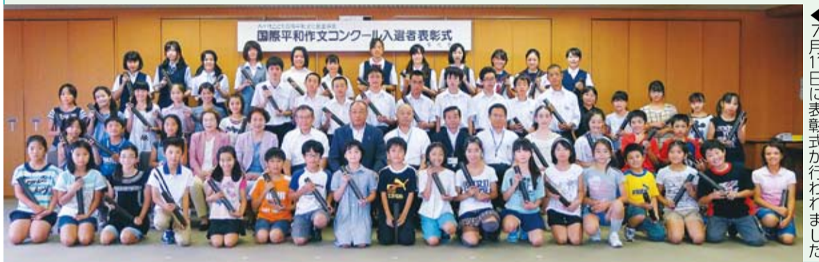
7月11日に表彰式が行われました

入選作品をまとめた作文集「君たちを忘れない」第24集は、25年3月頃から市内の図書館で閲覧できます。また、入選者の中から八千代こども親善大使10人が選ばれ、友好都市バンコク都を訪れます。