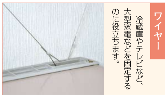
ワイヤー 冷蔵庫やテレビなど、大型家電などを固定するのに役立ちます。