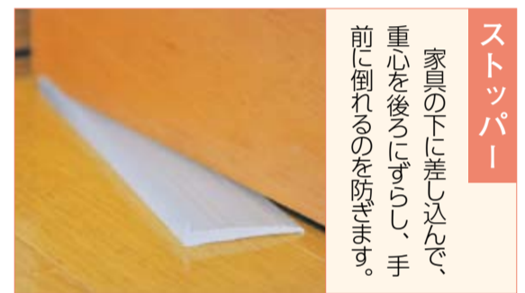
ストッパー 家具の下に差し込んで、重心を後ろにずらし、手前に倒れるのを防ぎます。