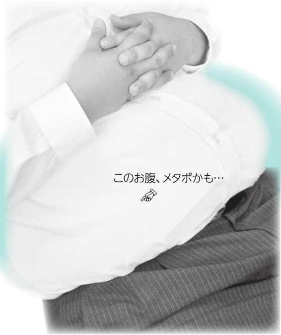
このお腹、メタボかも…

10年前に比べるとポッコリしてしまったお腹。「ただ太っているだけ」と思い込んでいませんか。生活習慣病を放っておくと動脈硬化が進み、心臓病・脳卒中など命にかかわる病気を発症することも。特定健康診査・特定保健指導は、メタボリックシンドローム(内臓脂肪症候群)に着目し、予防・改善を目的としたものです。特定健康診査で体の状態をチェックし、特定保健指導でのアドバイスやサポートで生活習慣を見直し、いつまでも健康に過ごしましょう。