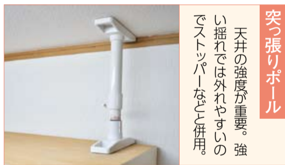
突っ張りポール 天井の強度が重要。強い揺れでは外れやすいのでストッパーなどと併用。