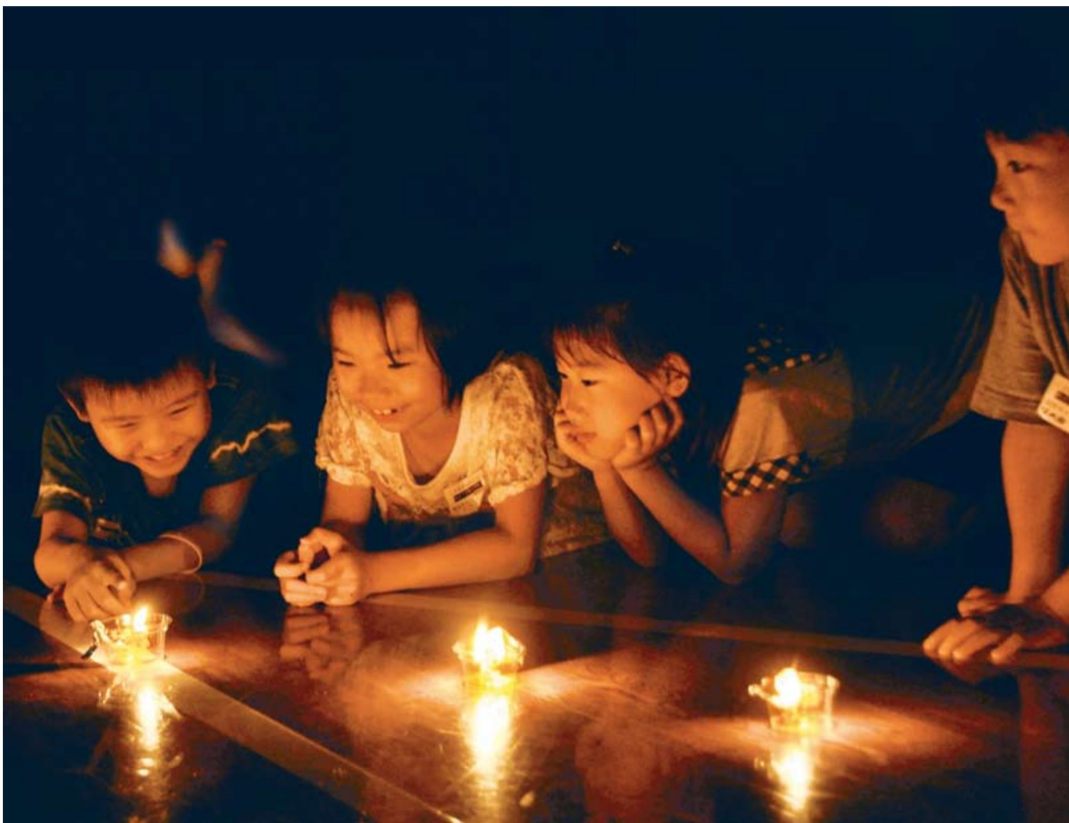
▲アルミ箔とティッシュペーパーを材料に作った手づくりのキャンドル。いくつも合わせるとコンロの代わりにもなります

大震災に備え、8月4日に開催された“みどりが丘小学校避難キャンプ”。同校の児童と保護者、学区内の住民など約100人が泊まりがけで避難所生活を体験しました。これまで交流のなかった人たちが顔を合わせることで、災害を協力して乗り越えるための地域の防災力を高めることが狙いです。キャンプは“震度6強の地震発生”のメールを合図にスタート。八千代緑が丘駅前でのバケツリレーや、災害調理器を使った夕食作りなどを体験しました。夜は停電を想定した真っ暗な体育館の中、「去年の地震は本当に怖かった。大きな地震がきても今日のようにみんなで協力して行動したい」と一日を振り返り、感想を発表し合いました。