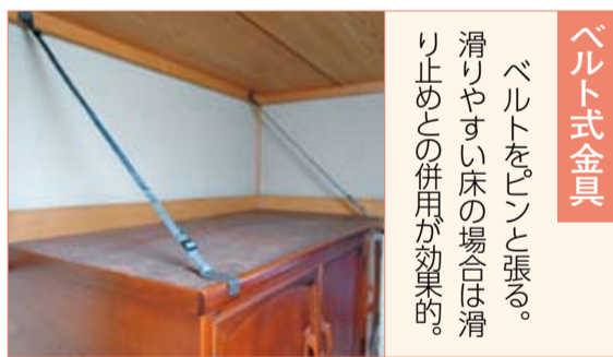
ベルト式金具 ベルトをピンと張る。滑りやすい床の場合は滑り止めとの併用が効果的。