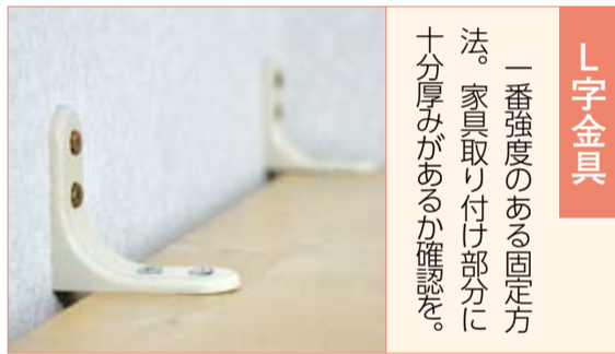
L字金具 一番強度のある固定方法。家具取り付け部分に十分厚みがあるか確認を。

取り付ける際は複数の器具を併用してください。ねじを使う場合は、短いと壁から抜けてしまうので、確実に固定できる長さの物を使い、しっかりとした下地に取り付けてください。