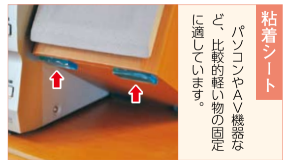
粘着シート パソコンやAV機器など、比較的軽い物の固定に適しています。