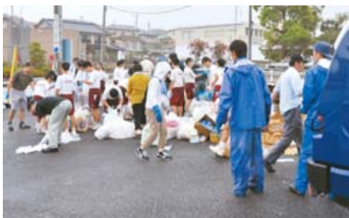
▲回収してきたごみを分別して資源物へ