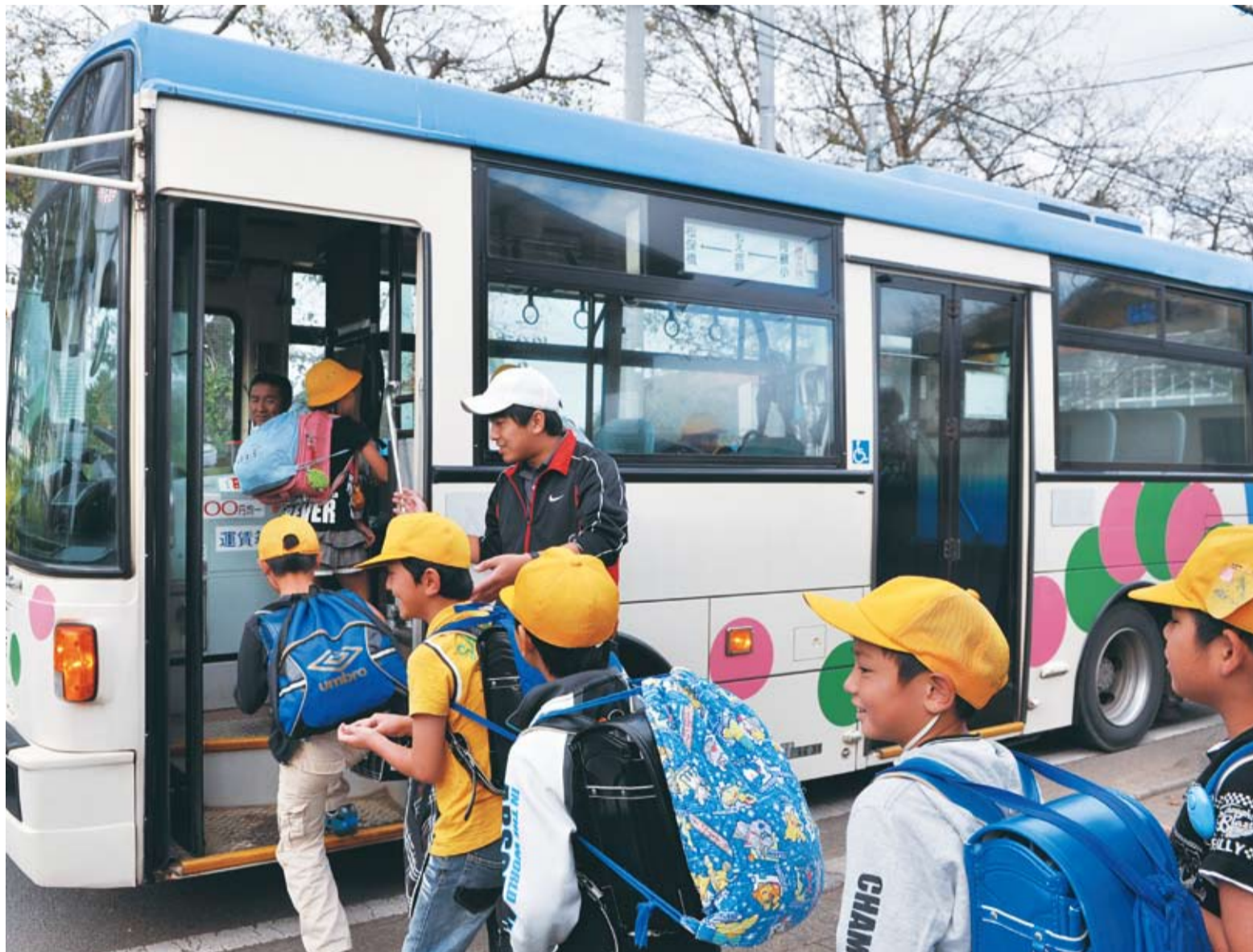
▲阿蘇小学校と睦小学校の通学支援としても、登下校に利用できるバスを1日各3便運行しています(10月10日、阿蘇小学校バス停)

市内公共施設循環バス「ぐるっと号」に代わって、9月1日から1年間、コミュニティバスを試行運行しています。交通が不便な地域や民間のバス路線などの役割分担を考え、要望が多かった土曜・日曜日の運行、鉄道駅への乗り入れを実施。コースを7つに増やし、買い物や通院など「生活の足」として利用しやすくなっています。「ぐるっと号」で使っていた車両4台を使用し、運賃は同一コース内であれば均一料金200円。未就学児は無料、小・中学生、障害者は80円です。試行運行期間中に利用状況の調査などを行い、今後の運行を検討します。 ※市広報番組「やちよNavi」でも、関連番組を放送中。案内は8ページに掲載