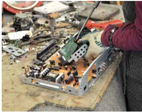
金属類は手作業で取り外され、リサイクルされます

「家庭ごみの分け方出し方」の冊子は、市役所2階クリーン推進課、支所・連絡所で配布しています。また、市ホームページや、携帯電話用ホームページでも見ることができます。